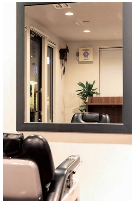
白い壁に映えるウッドフレームの鏡面