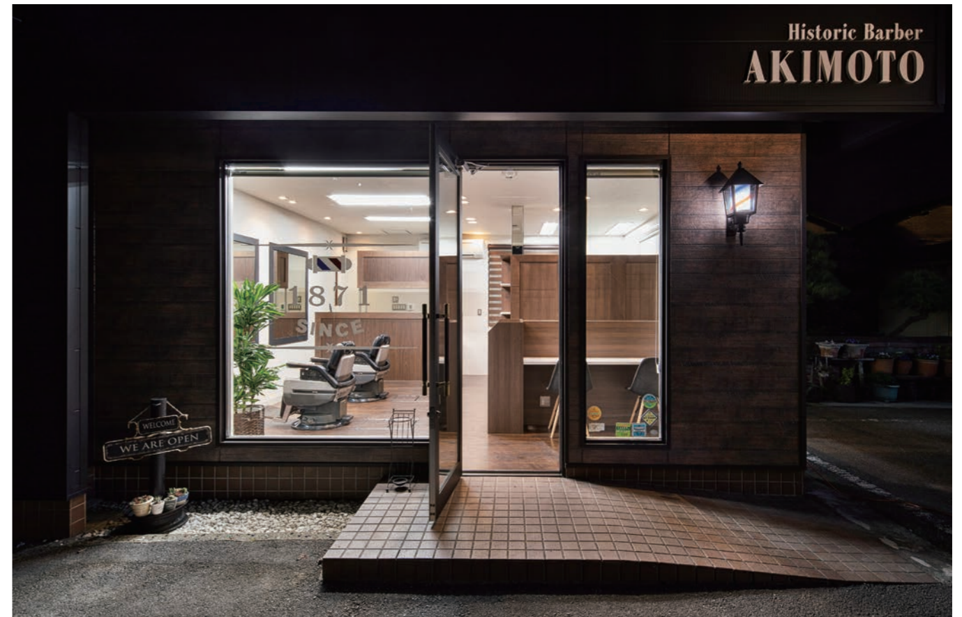
バリアフリーのエントランスは広いウインドでスッキリとモダンに