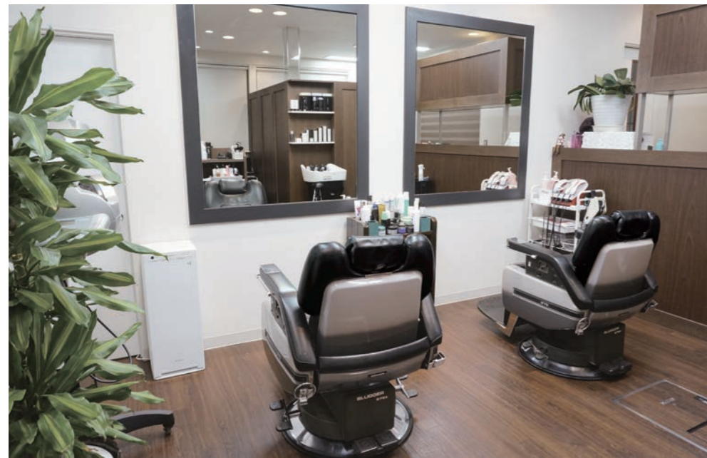
白と濃茶で落ち着いた雰囲気、技術ブース