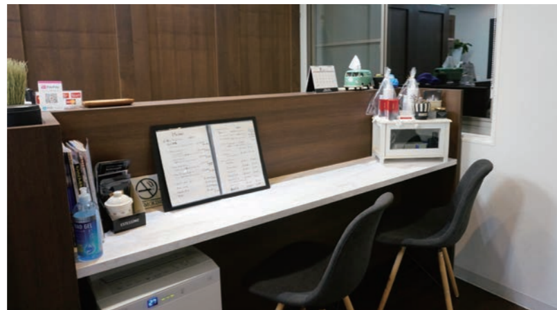
レセプションカウンターと対面式の客待ち