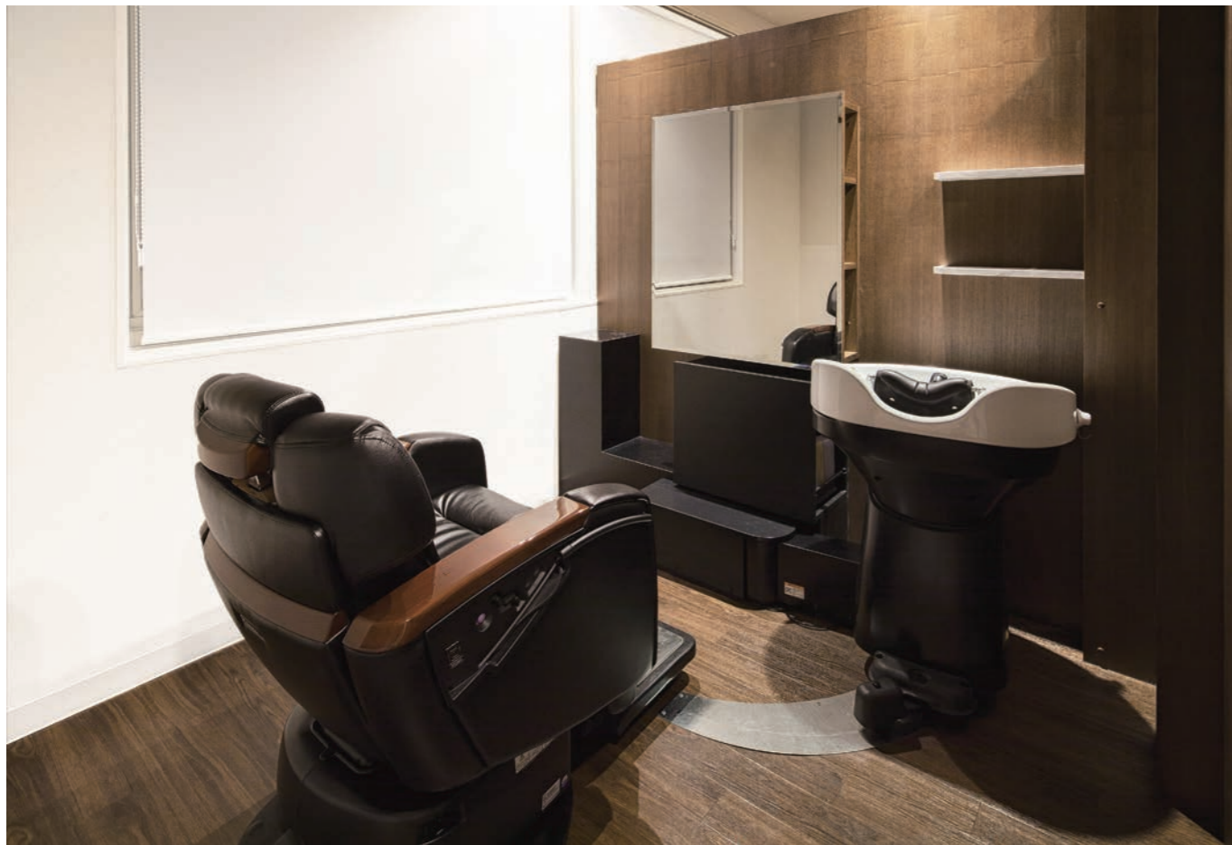
重厚感をプラスした個室はまさにVIPルーム