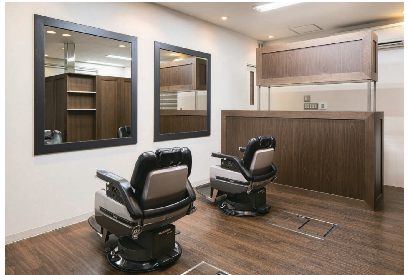
ディスペンサリートの間仕切りにもこだわりが