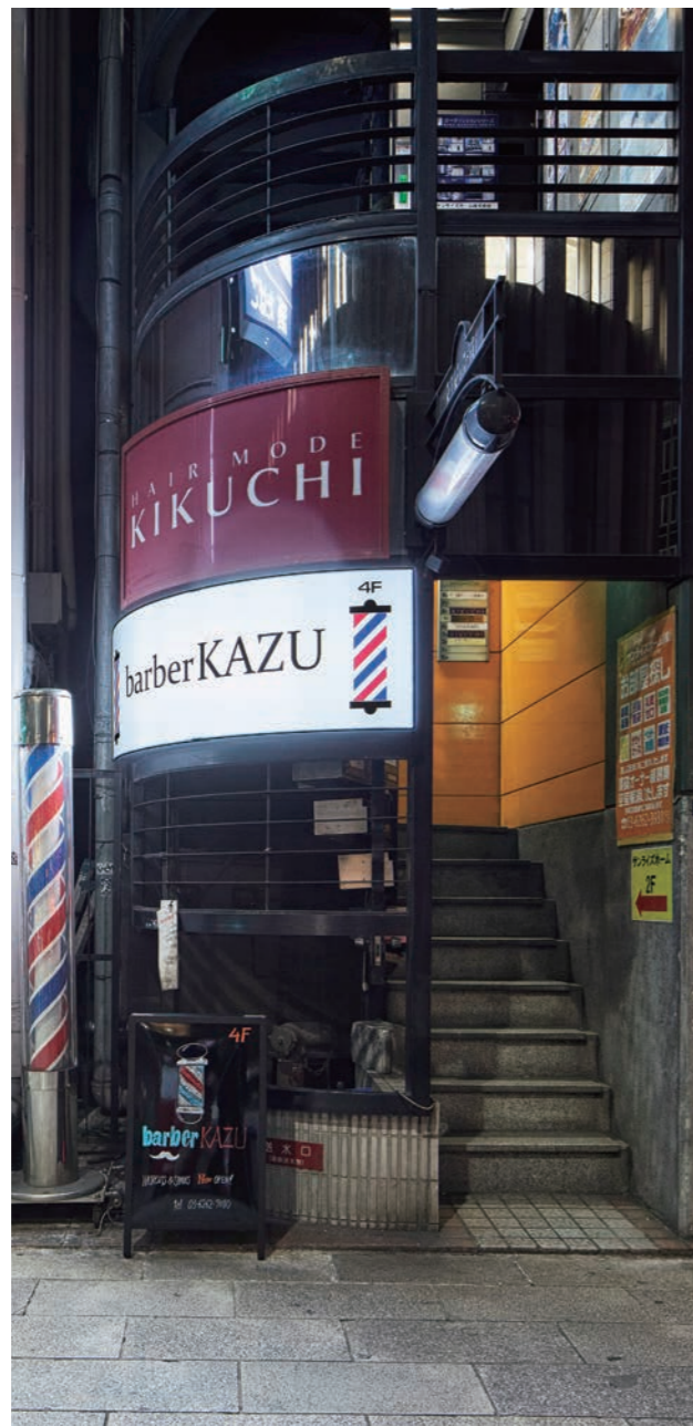
barberKAZUの電気サインがよく目立つ外装