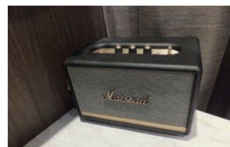
時代モノのアンプもディスプレイには最適