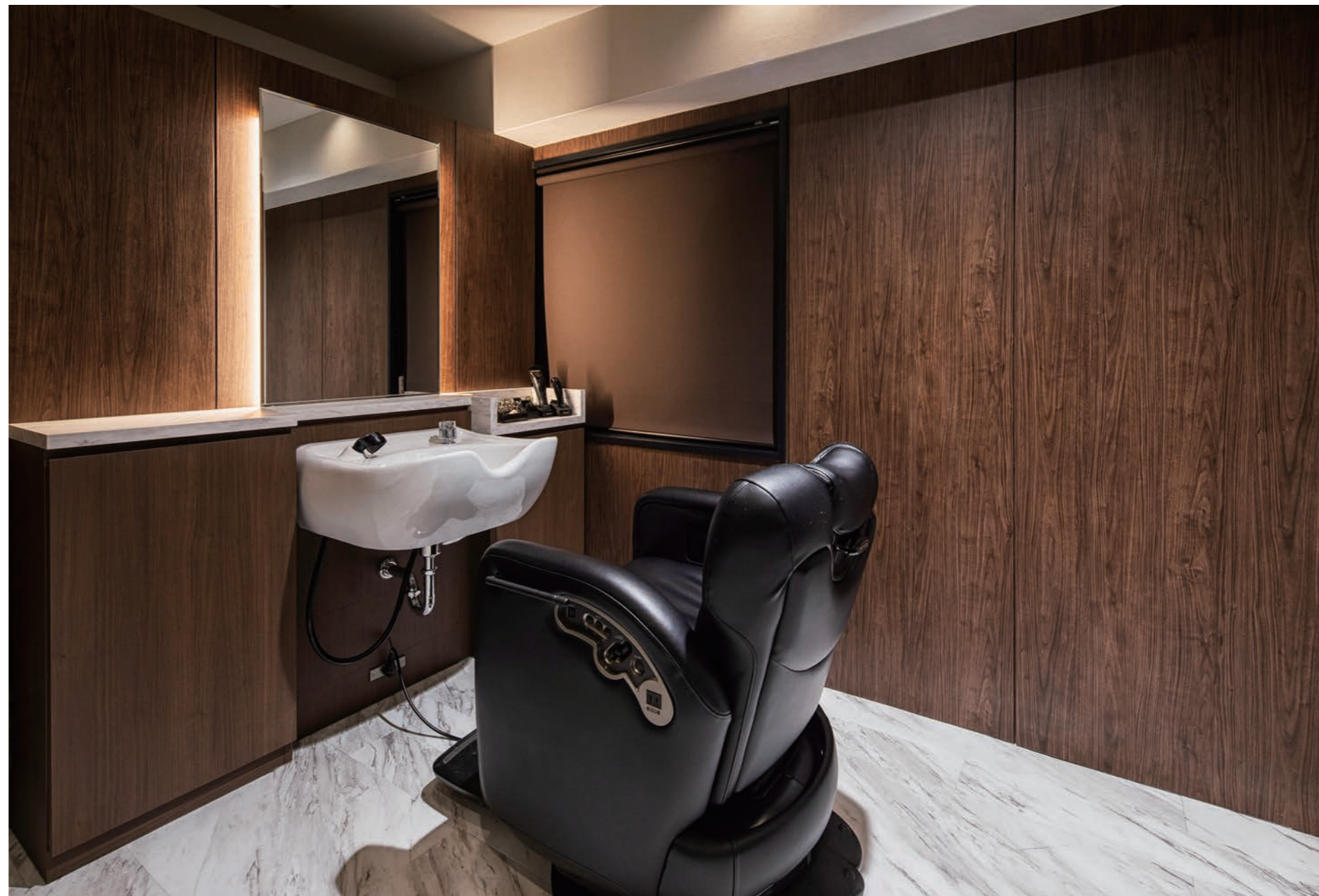
照明は間接照明やスポットで調光できる