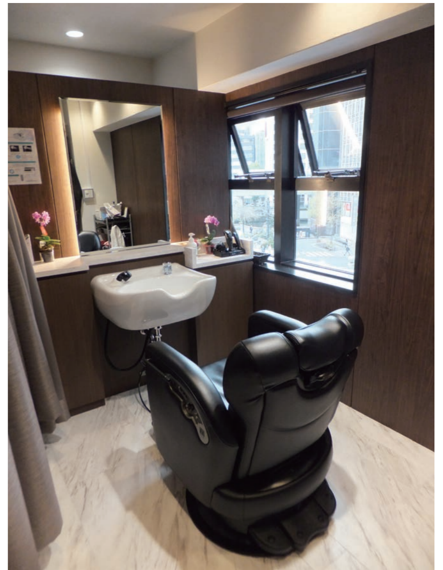
お客さまに、ゆったり感を味わってもらうのがコンセプト