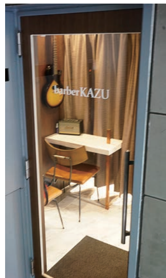
ドアもロゴだけにしたエントランス