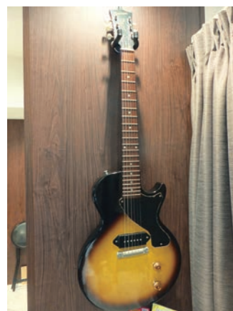
名器といわれるギターもディスプレイして