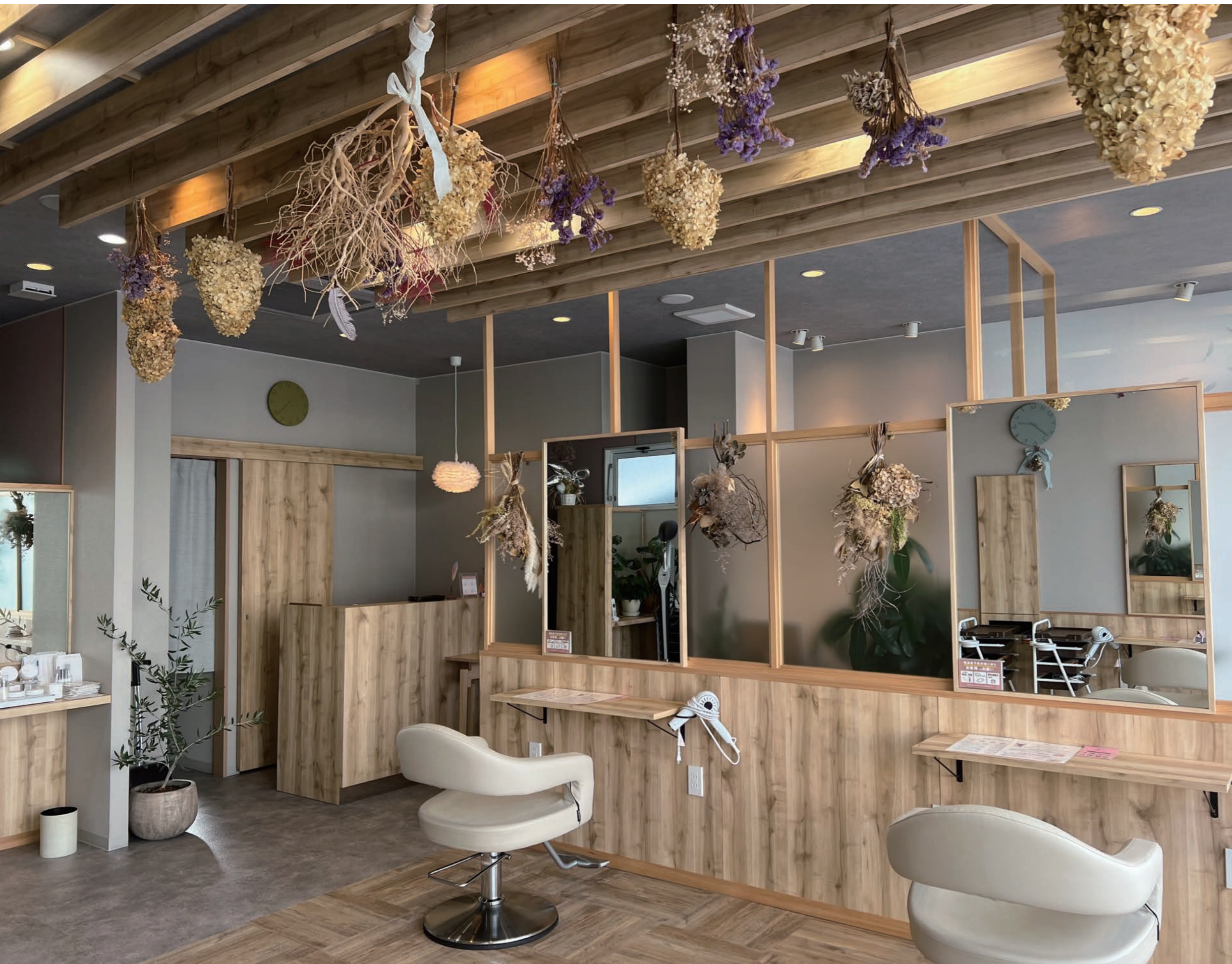
壁やパーティションの木目とマッチングさせたドライフラワーが店内随所に。磨りガラスや透明ガラスの仕切りで光を取り入れている