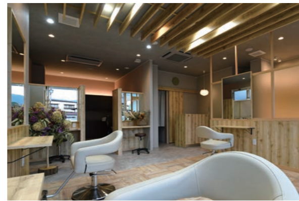
木の温もりを充分に楽しめる店内は、カフェ風。天井には木製ルーバーを設置

お客様のスタイル写真を撮る背景はロゴマーク・シンボルマークをデザインしたオリジナルの壁紙。夫妻のラッキーカラーがピンクとグリーン、ブラウンと黒。羽をその4色にして空から舞い降りてくるイメージに