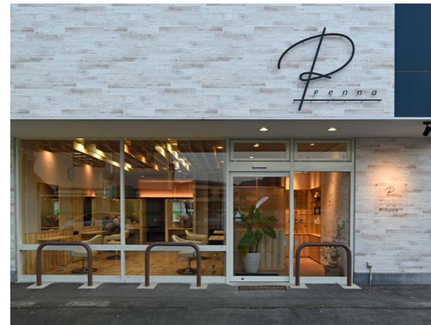
広い間口を活かし、店内もアピールできる外装

お客様のスタイル写真を撮る背景はロゴマーク・シンボルマークをデザインしたオリジナルの壁紙。夫妻のラッキーカラーがピンクとグリーン、ブラウンと黒。羽をその4色にして空から舞い降りてくるイメージに