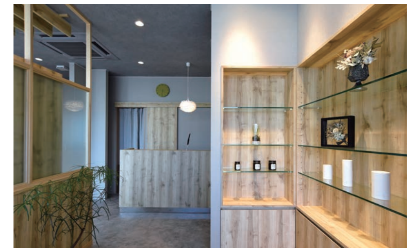
飾り棚のバックボードも木目というこだわり