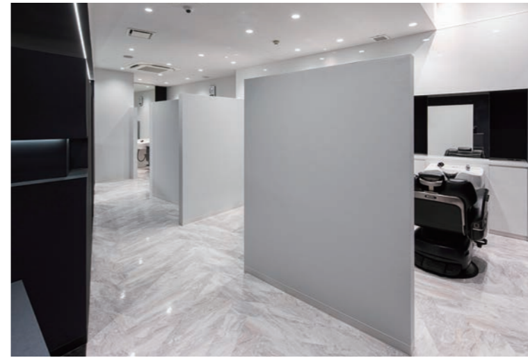
店内はほぼダウンライトのみの照明