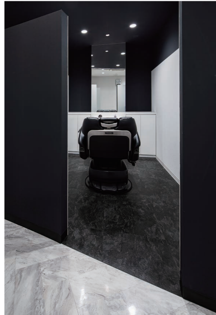
全席個室でどの部屋もほぼ同じ広さ