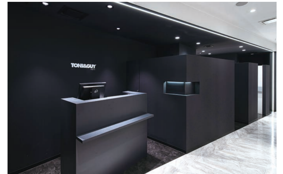
レセプション上の梁と柱の部分は一直線につながるフレームライトが