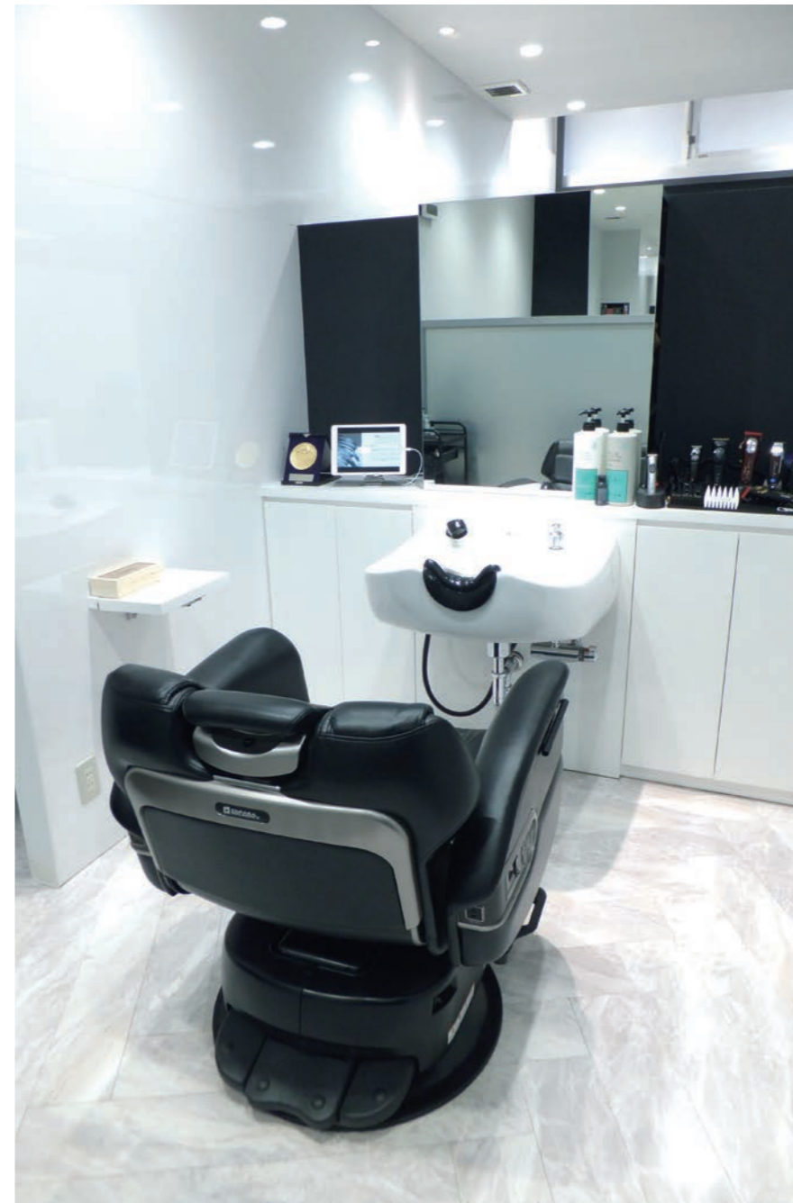
技術椅子はすべてエグゼクティブ仕様