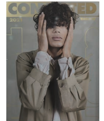
店内の飾りはTONI&GUY2021年のイメージポスターのみ