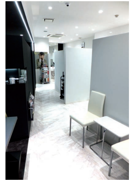
客待ちの椅子は白、他のインテリアなども白または黒で統一