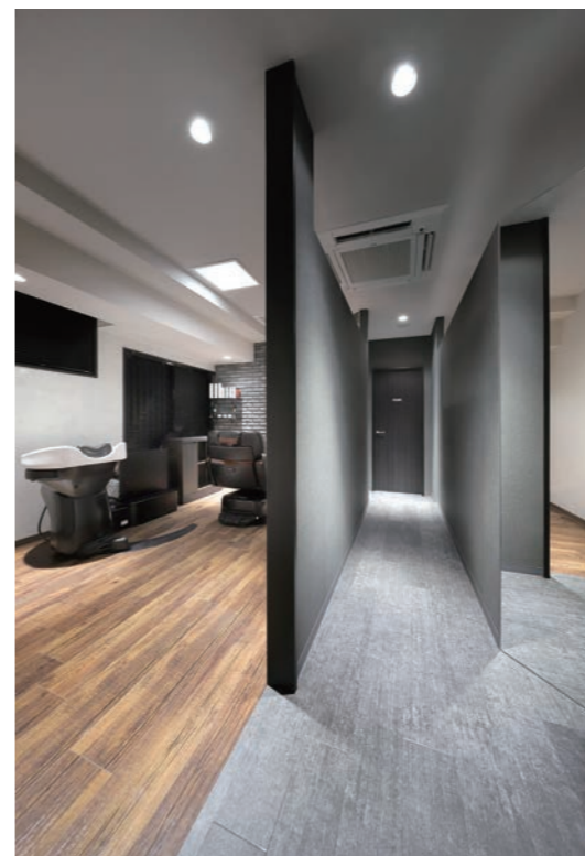
店内はエリアごとに床材を変えてアクセントにしている