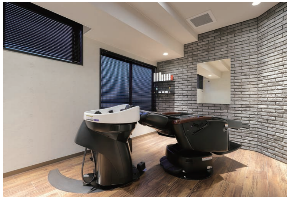
癒しがメインメニューのため技術椅子もフルフラット仕様になっている