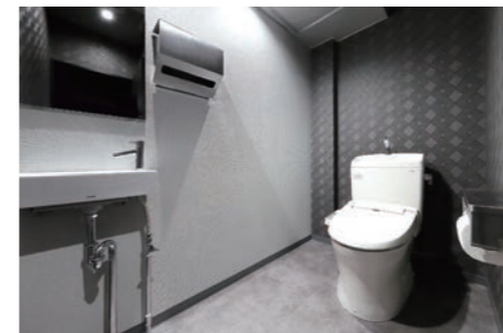
モノクロームの世界を思わせるレストルーム