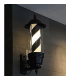
サインポールは店内に