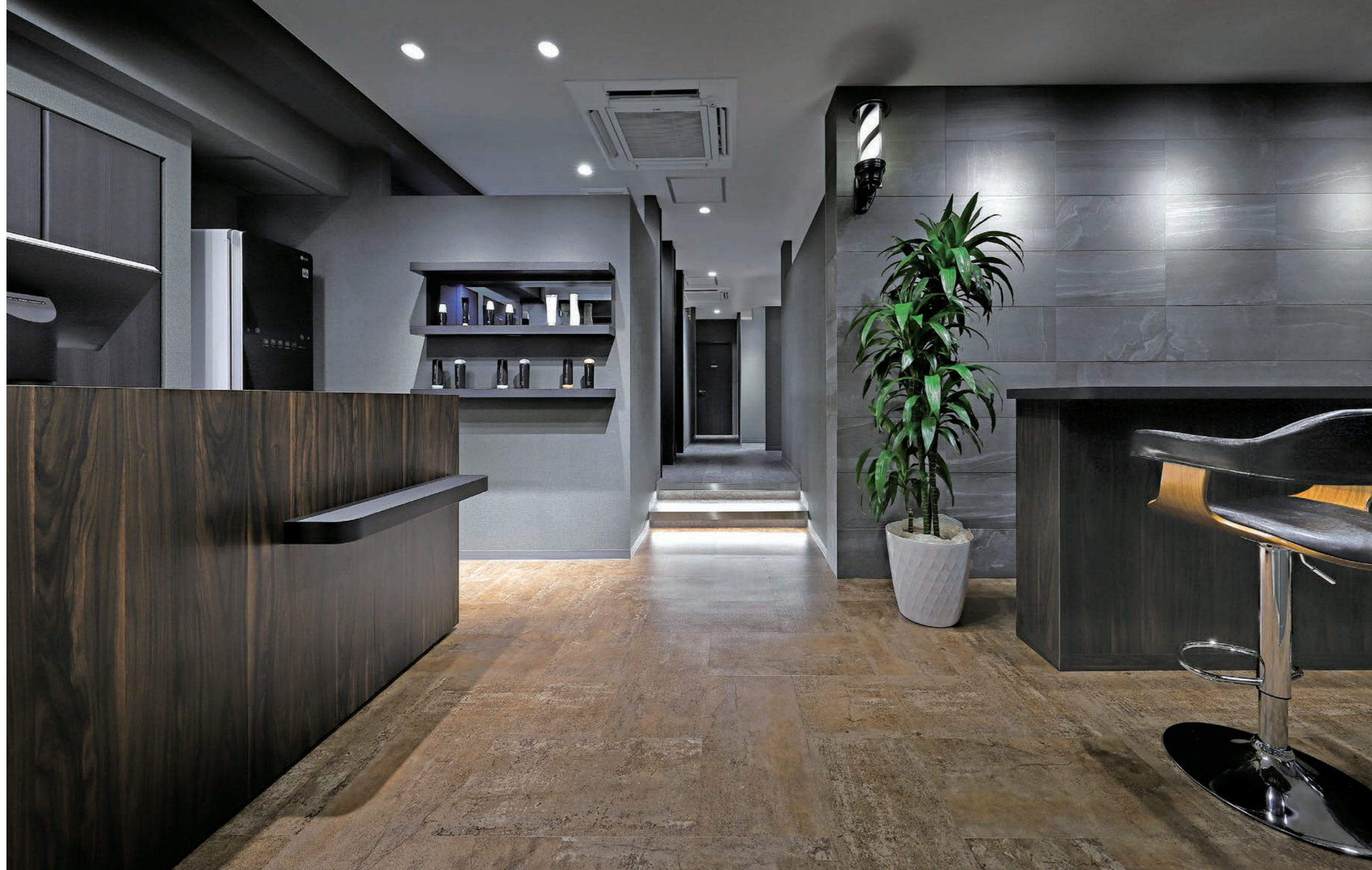
左がレセプション、右が客待ちで中央通路で左右の個室をセパレートしている