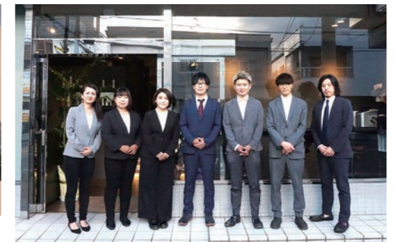
SiGN annex と SiGN のスタッフの皆さん