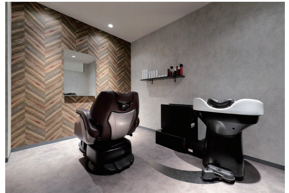
3個室とも壁面と床面を変え、それぞれ趣きを変えている。壁がヘリンボーンのこの部屋は若いお客さま向き

data 新装年月 / 2021年10月 面積 / 82㎡ 椅子台数 / 3台 立地 / 商店街の一角。周りは住宅地 最寄り駅 / JR 仙石線・若竹駅から徒歩5分 設計施工 / タカスペースデザイン株式会社、タカラベルモント株式会社 営業時間 / 平日 10:00 ~ 20:00 / 祝祭日 9:00 ~ 19:00 おもな客層 / 30 ~ 40代男性がターゲット。経営者や美意識高いビジネスマンが多い 料金 / カット 7000円~, カラー 8500円~, パーマ 13500円~ ヘッドスパ 5000円~, レディースシェービング 5000円~