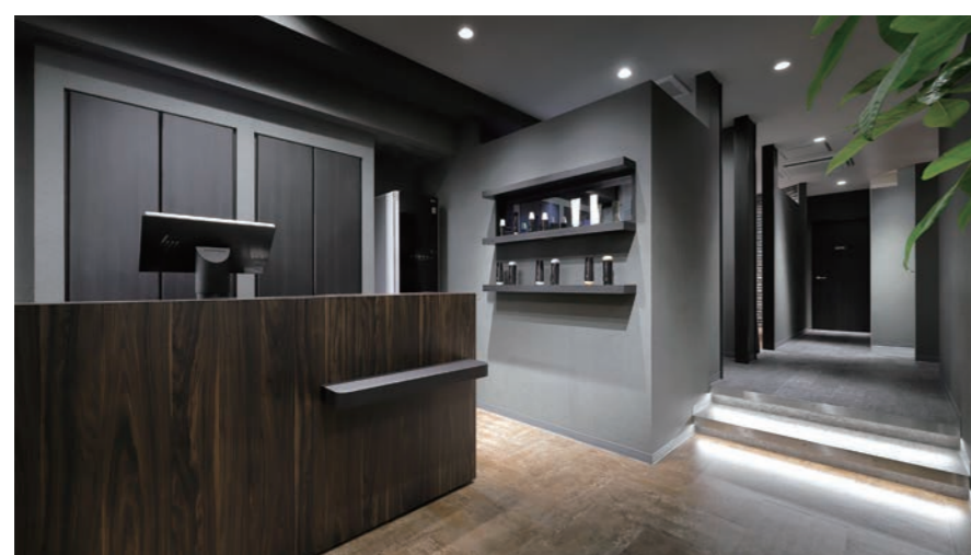
レセプションの後ろはクロークと収納、そしてお客さまに好評なホームクリーニング機を設置