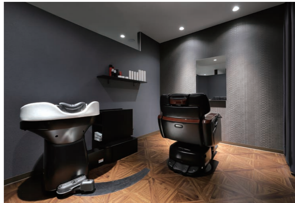
重厚感のあるグレー基調の個室はシックな大人の男性が似合う