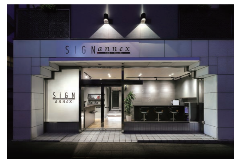
おしゃれ感あふれ、店内の様子が伝わる外装