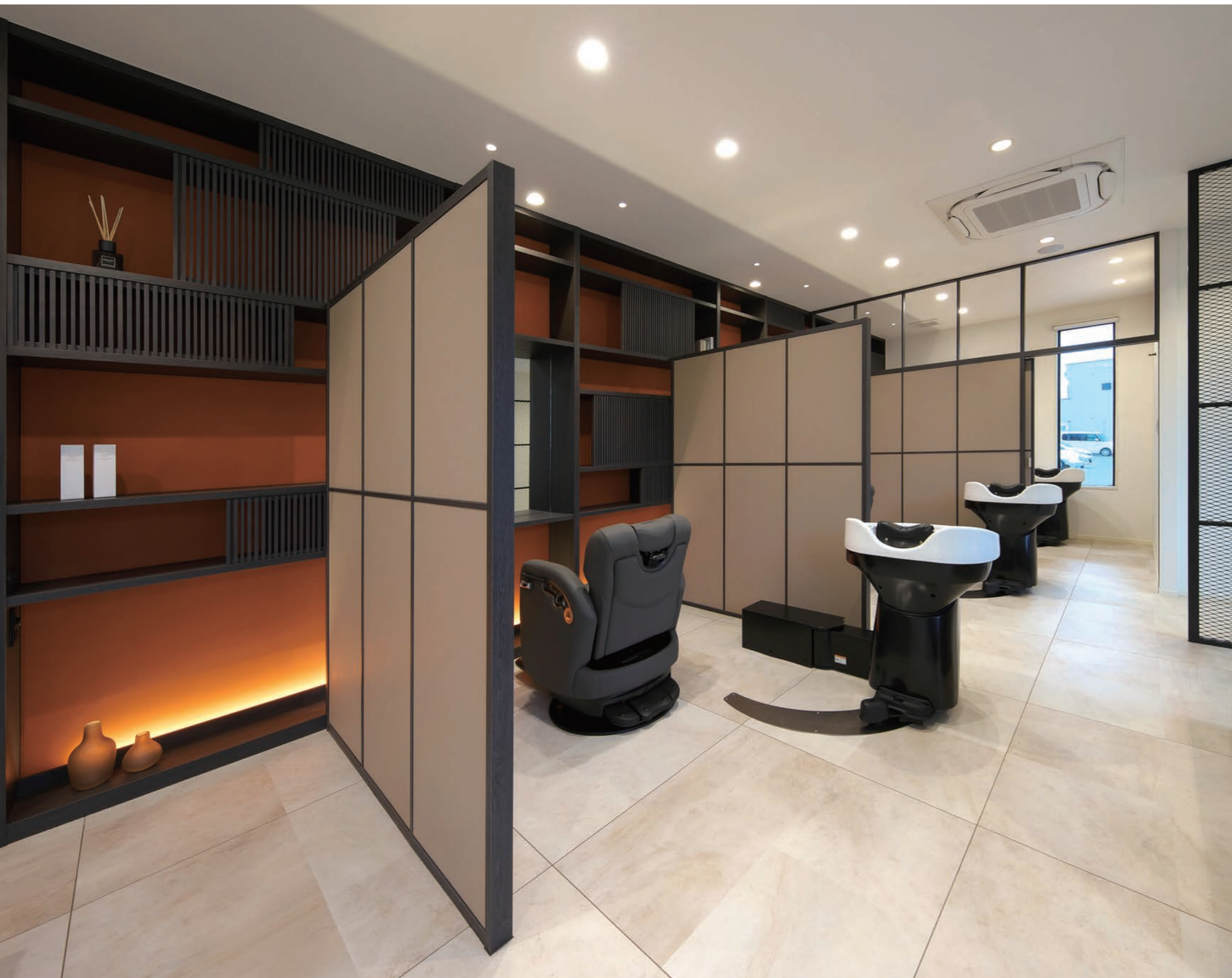
半個室はゆったりとして施術を受けられる