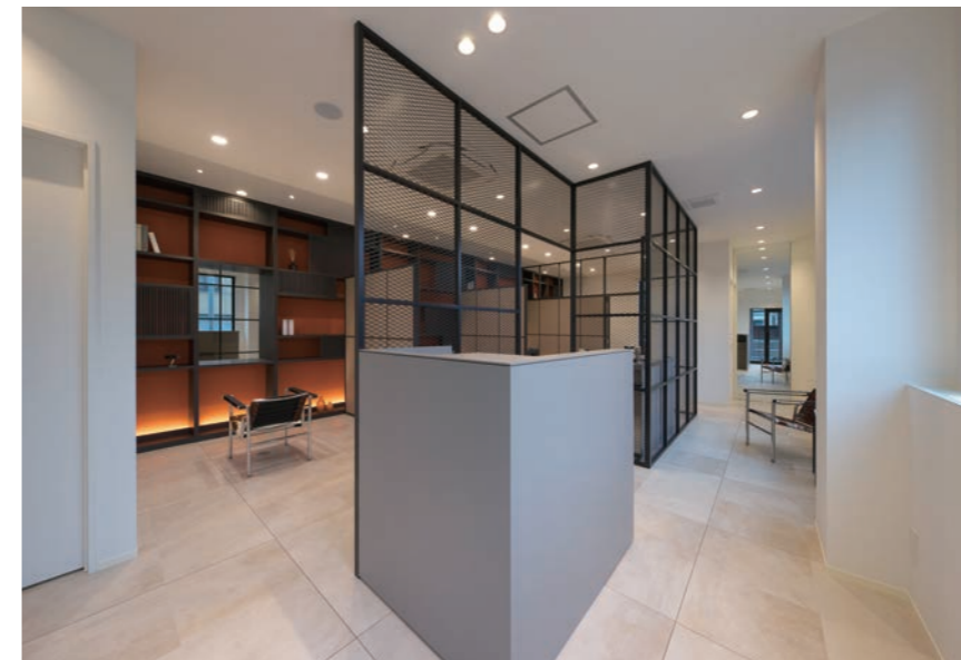
ネットの間仕切りなので採光も見通しも利くレセプション