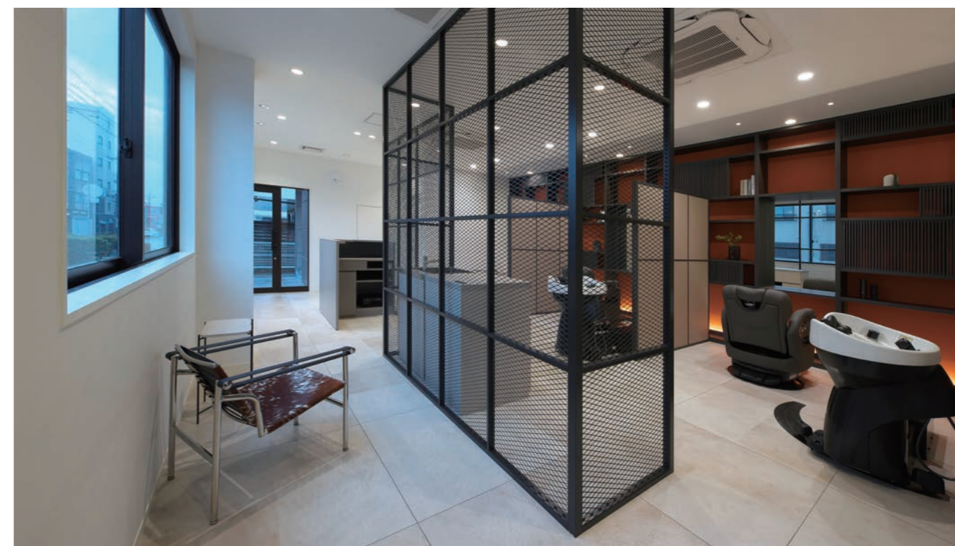
間仕切りのネットが独特なムードを醸し出す店内