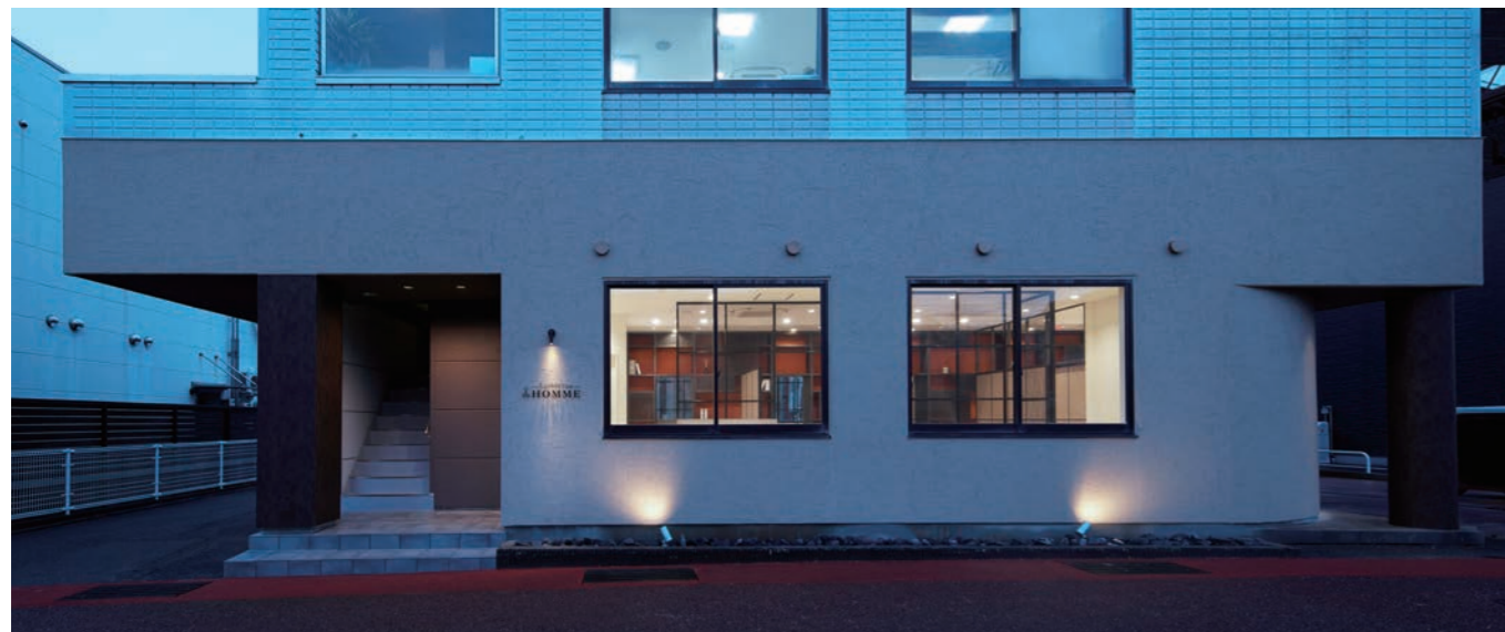
すっきりとした外観