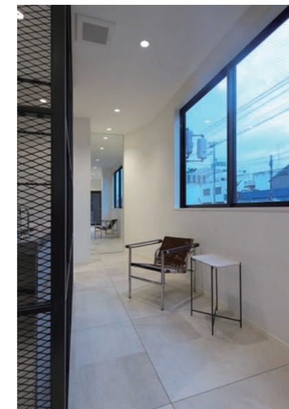
客待ちはいたってシンプルに