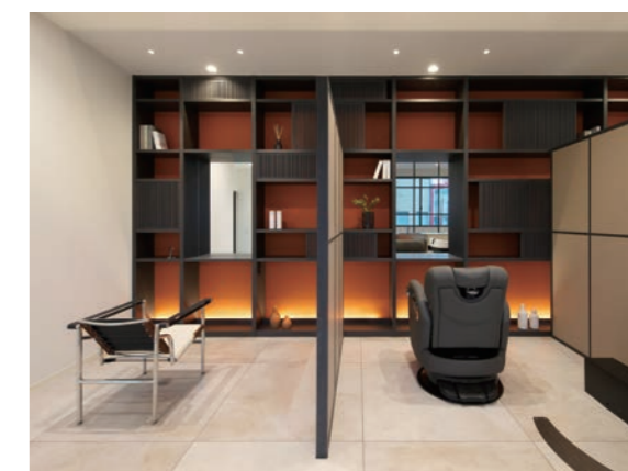
半個室に隣接したカウンセリング席