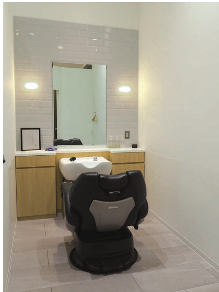
鏡面がある壁面のホワイトタイルには懐かしさもうかがえる