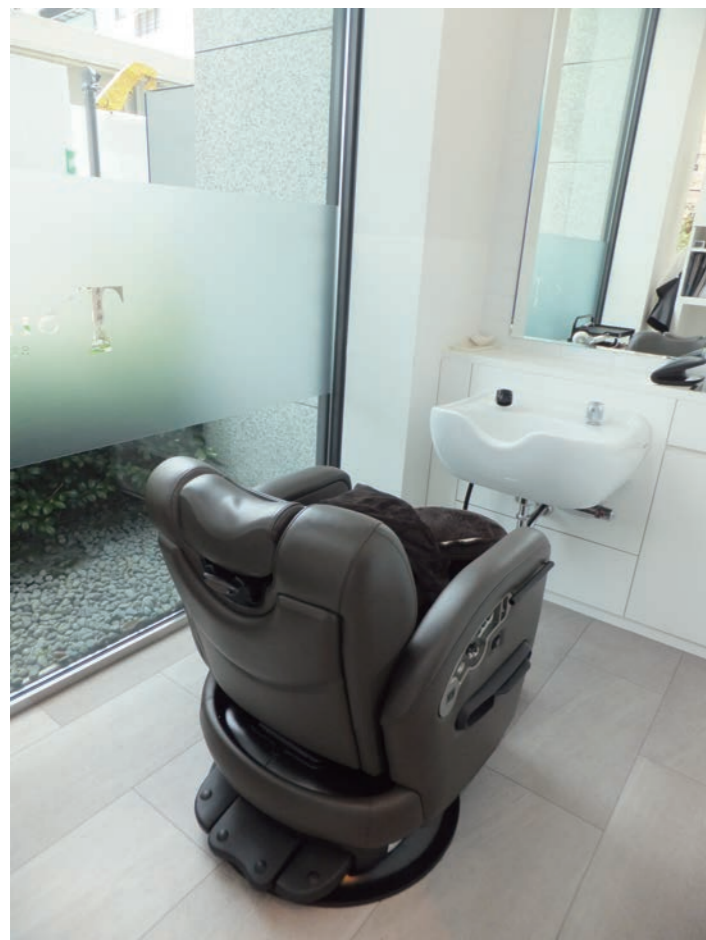
路面店ならではの坪庭を配した個室