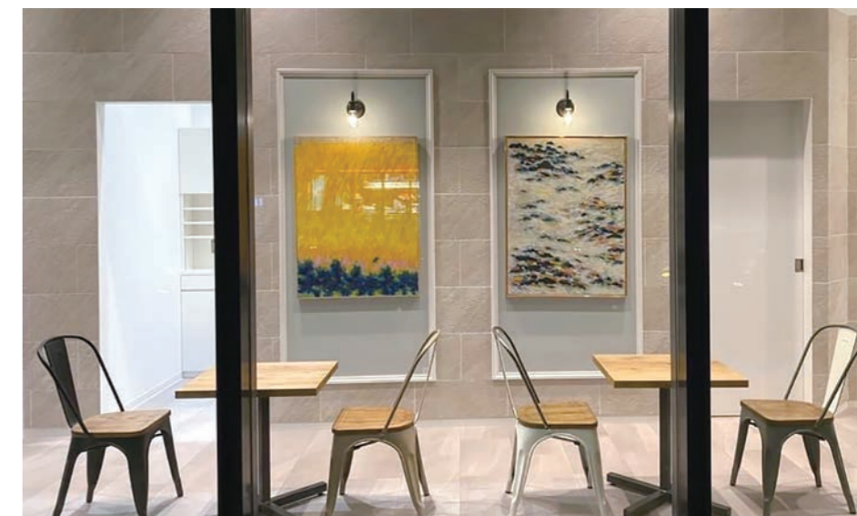
客待ちは絵画がディスプレイされてギャラリー風