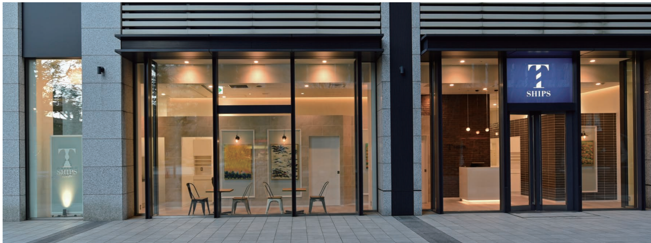
ショッピングゾーン全体に統一されている大きなウインドは、外国のショッピング街を思わせる