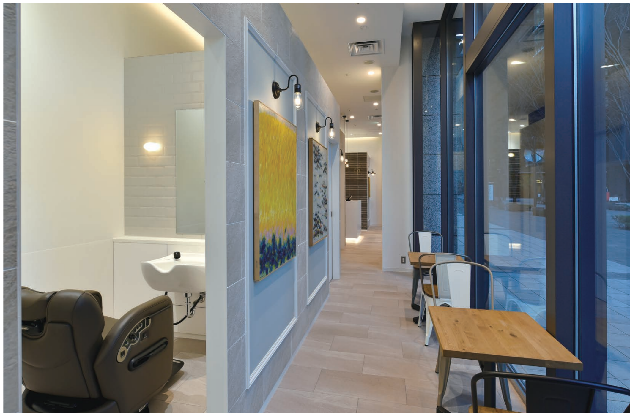
ウインドに沿った通路は客待ちになっており 絵画もじっくり観賞できる