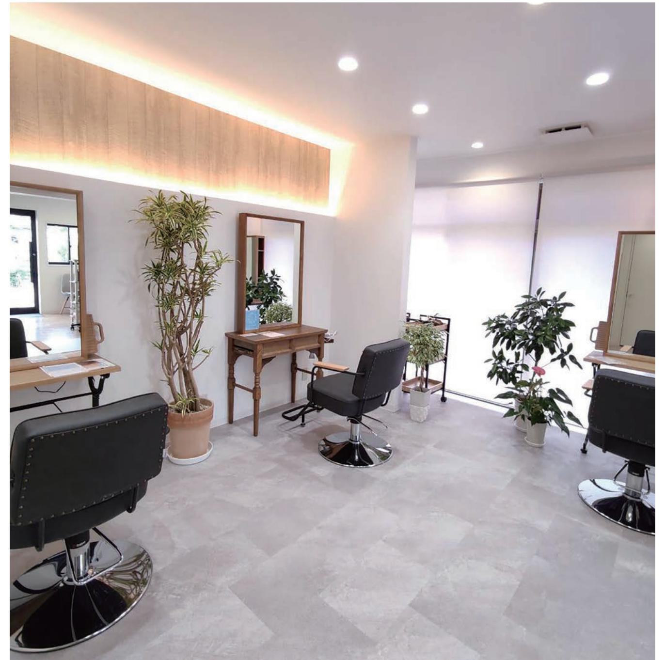
ナチュラルテイストの技術ブース

通りから入り口までスロープにして、店内もフラットになっている。庭には人工芝を敷きつめた。電車が近くを通っているので外から中が見えないよう、木製の目隠しフェンスを置いている