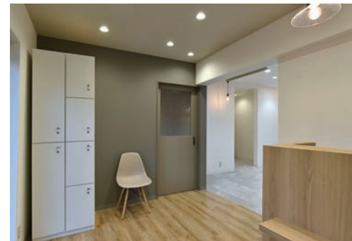
レセプションが無人になることもあるため、ロッカーを設置。キーはお客さまが管理