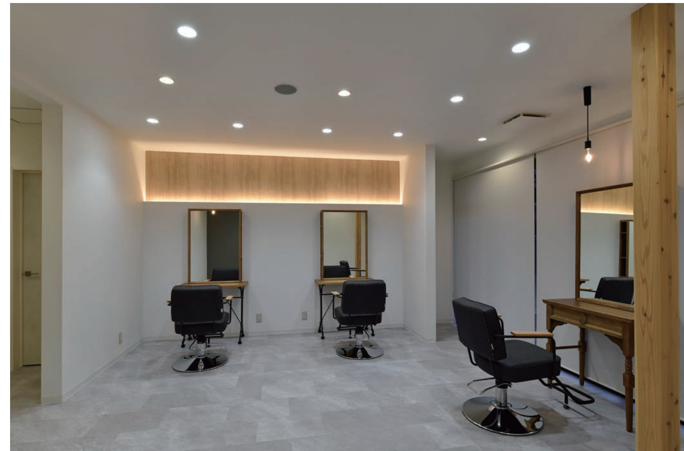
木目が映える間接照明が特徴的な技術ブース