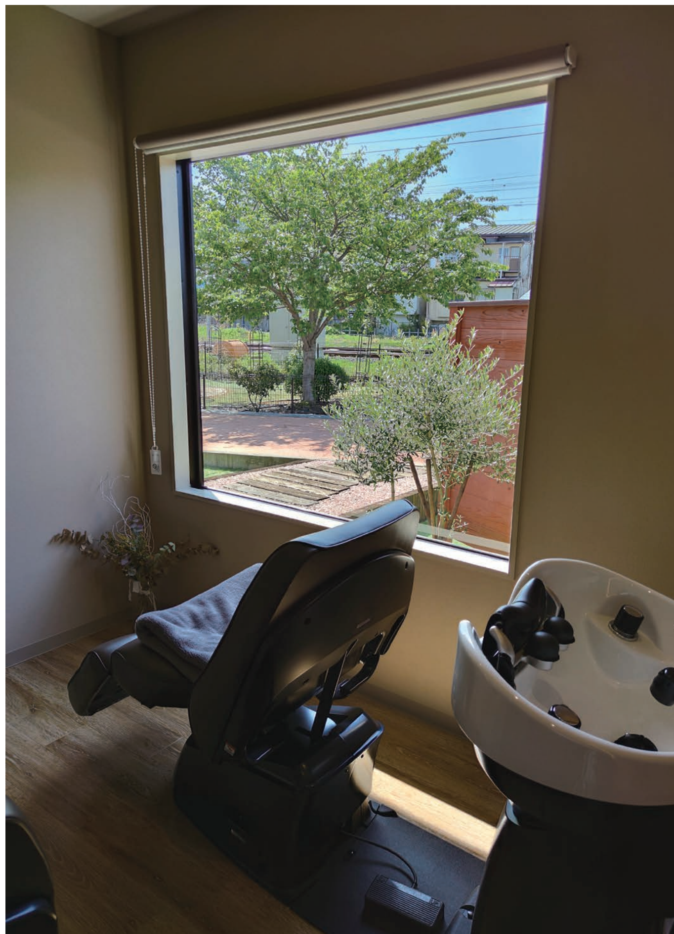
大きな窓から、前庭のオリーブの木が見える。さらに道路を挟んで公園があり、桜やバラなどが眺められ四季を感じられる。お客さまも技術者も、ここから見る景色に癒やされるという午前中と夜（ライトアップ）はブラインドを全開にして仕事ができるため心が和み、大きな窓にした効果は想像以上に大きかったとのこと