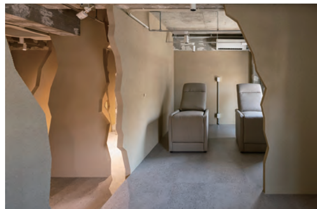
アイラッシュスペース