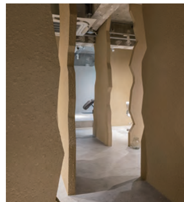
アプローチの先にあるシャンプーブース