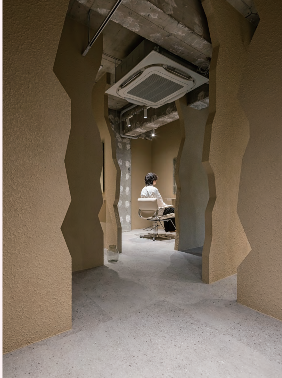
岩山の向こうにあるセット面