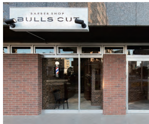
外観。内外が連続する