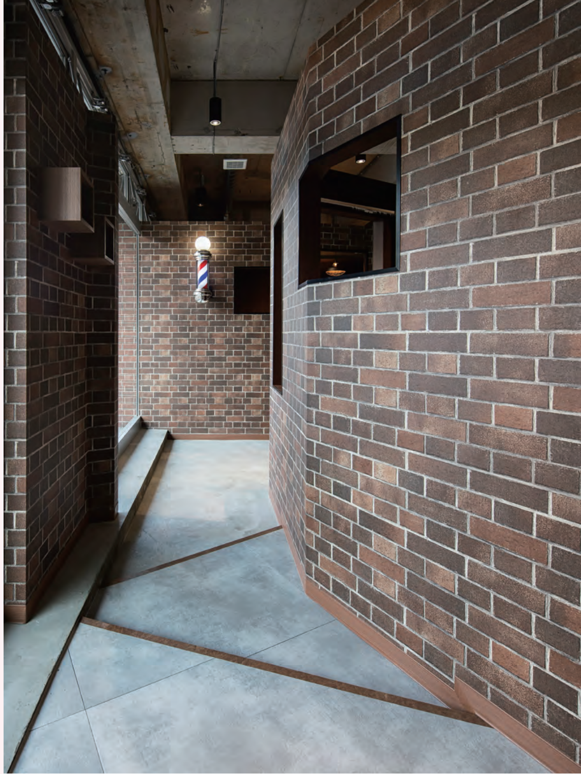
エントランスから見る