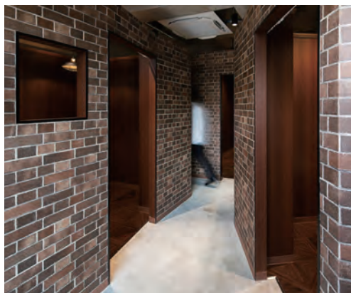
奥へと引き込まれるような路地