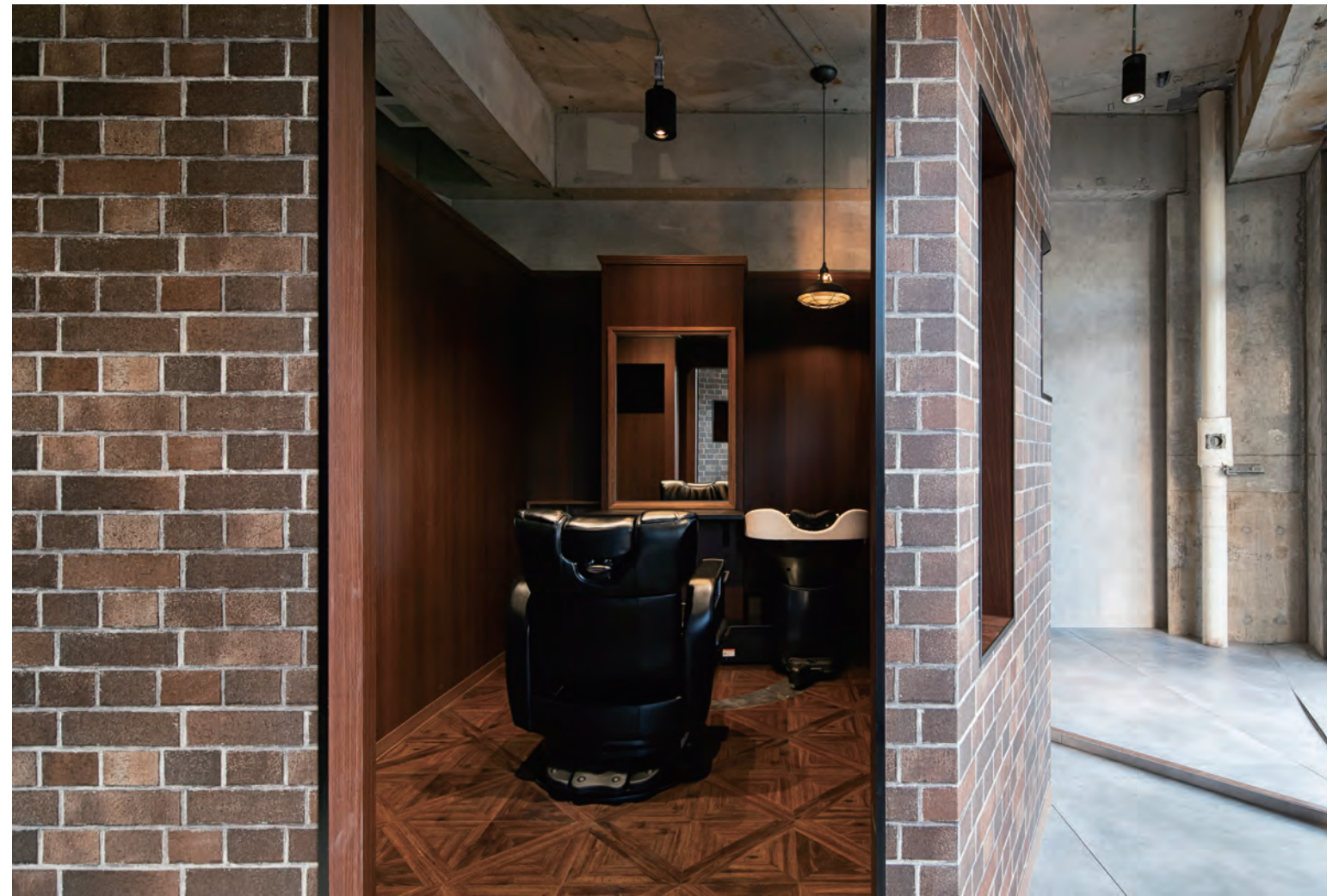
路地から個室を見る