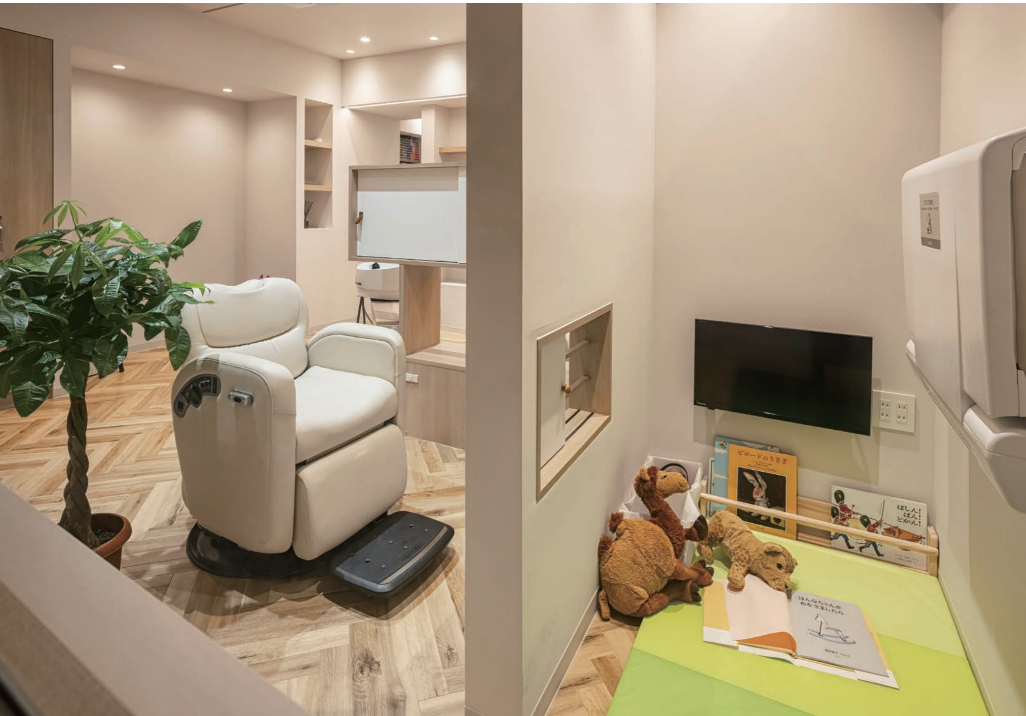
2歳と5歳の子供をもつオーナー目線で設計されたキッズスペース。おもちゃや絵本、DVDが見られるモニターが置かれている。鏡面の下に開閉式の小窓があり、お互いを感じながら親も子供も安心した時間を共有できる。キッズスペースにおむつ交換台、トイレにはベビーキープを設置。「おむつ交換台のある美容室は今まで見たことがない!」と驚くお客さまも多い。ベビーカーはそばに置くことができ、赤ちゃん連れでも気兼ねなく来店し、施術を受けることができる