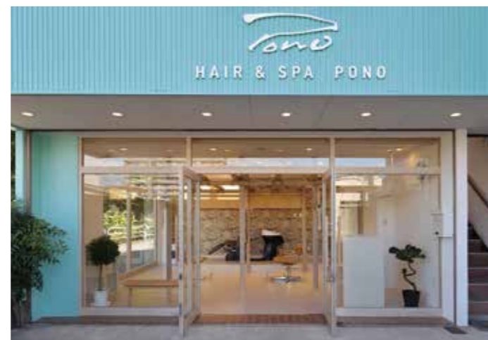
出入り口と大開口窓がガラス張りで、店内は明るく開放感がある