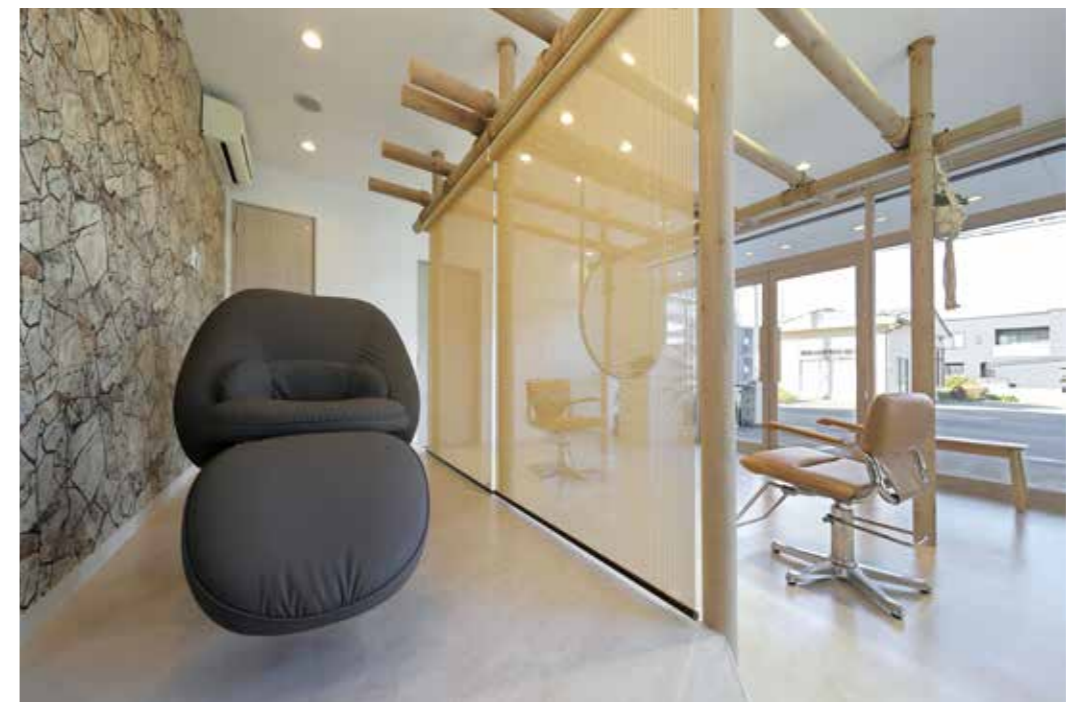
シャンプーブースの椅子はフルフラットになり、お客さまの首に負担がかからない。調光もでき、ブラインドを下ろせば半個室になる。今後は、ヘッドスパなどのメニューを増やして地域一番店を目指す