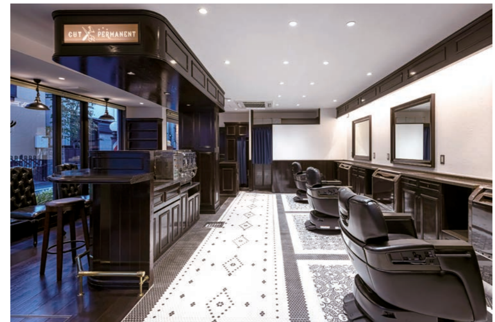
施術椅子に敷いたロンドンのカフェやパブで定番のモザイクタイルと通路のヘキサゴンモザイクタイルは、重厚感あるカウンターとともにブリティッシュのクラシックな雰囲気を醸し出している