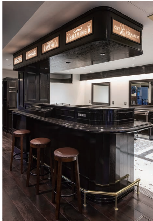
カウンター上部の飾り棚に、理容に関する英文の用語とイラストを描いている (オリジナル)