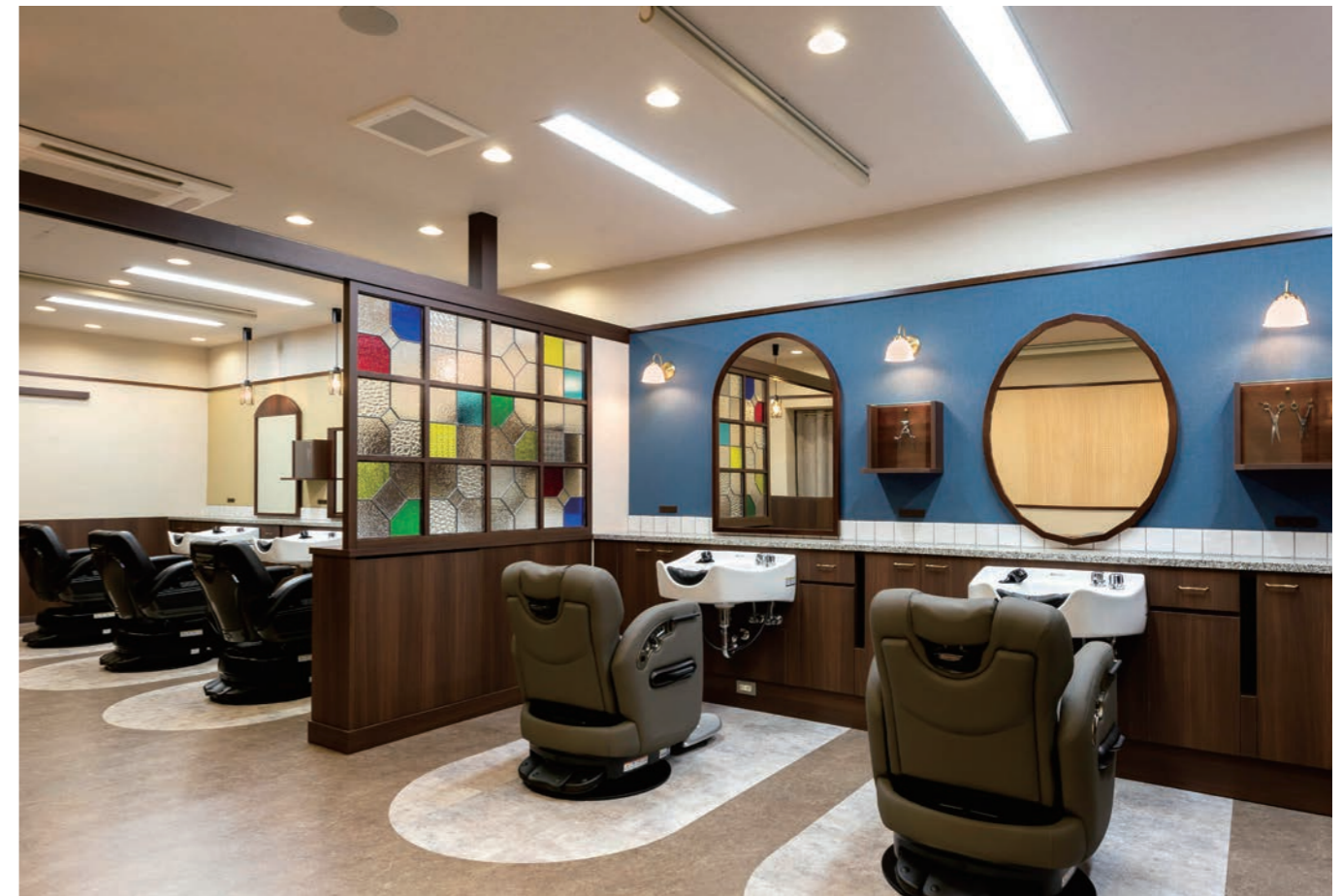
毎月のように来店する場所であり、いつも新鮮さを感じてほしいと、5席すべての鏡の形が違う。鏡の間には先代が使用していた理容器具を展示している

改装年月 / 2022年12月 面積 / 62.3㎡ 椅子台数 / 5台 設計・施工 / タカスペースデザイン株式会社 タカラベルメント株式会社 立地 / 商店と住宅の混在地域 最寄り駅 / 長野電鉄・須坂駅から徒歩12分 営業時間 / 平日8:50~18:20 祝祭日8:50~18:00 おもな客層 / 年代は幅広い。男女比率7対3 おもな料金 / カット4200円 カラー3850円~ パーマ4160円~