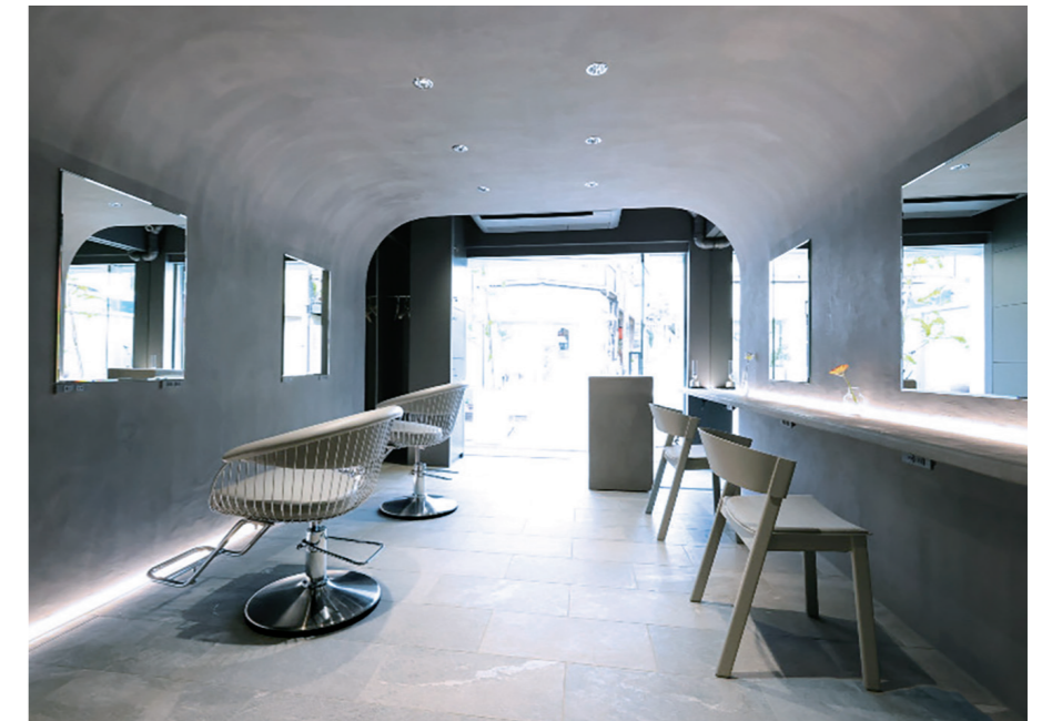
目の前には姉妹店 DryHeadSpa/Eyelash がある

「改装時にはこの椅子!」と決めていた椅子はすでに製造中止になっており、世界中のインテリアショップに問い合わせやっとなつかったという(右)