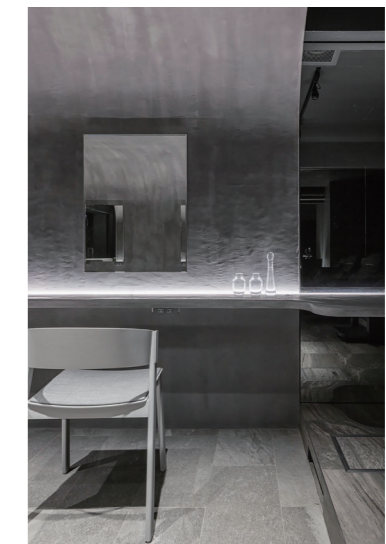
鏡の奥の世界まで気を配り、どこに座っても居心地の良い空間を目指した

開業から10年目のリニューアルは新規開店時とは異なり、お客さまの顔を思い浮かべて挑むことができたとのこと。お客さまとスタッフにもっと良い空間を提供したいと思い、数年前から構想しどんどんイメージが膨らんできた。決断してから約1年、デザイナーと日夜を問わず話し合い、情熱を注いで妥協することなく、理想のサロンができたという。