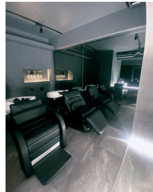
シャンプーブースは落ち着けるようブラックミラーを使用

店名の書かれている看板はステンレス製。店内との雰囲気を合わせるため、あえてヤスリをかけてマットにした。外から中への一体感を表したく、入り口に敷居をつくらなかった