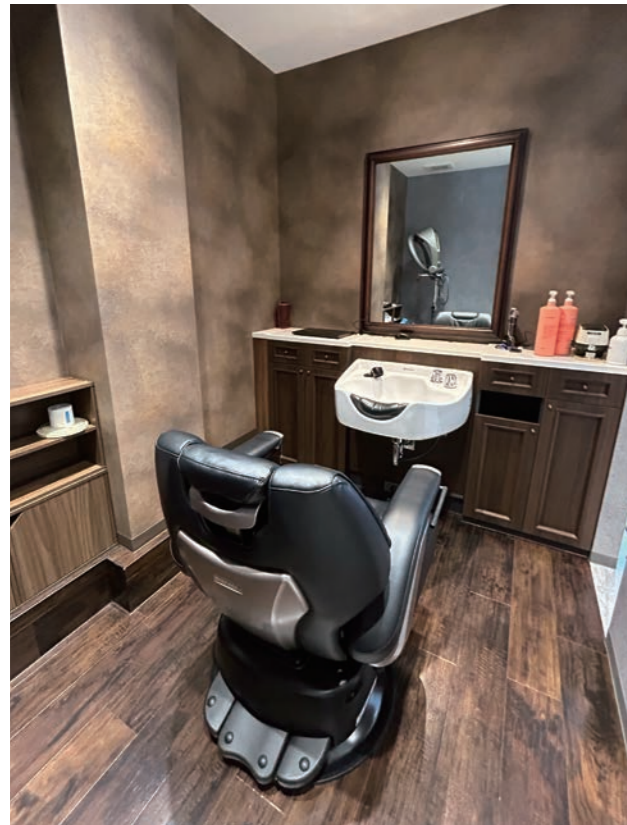
個室は趣を変えてウッディ調に。シックな雰囲気で特別感を演出