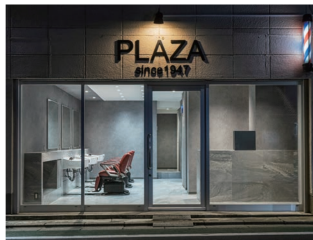
前面はガラス張りで、明るい店内。barber を強調しないようにしたため、ビューティサロンと誤解しているお客さまも……