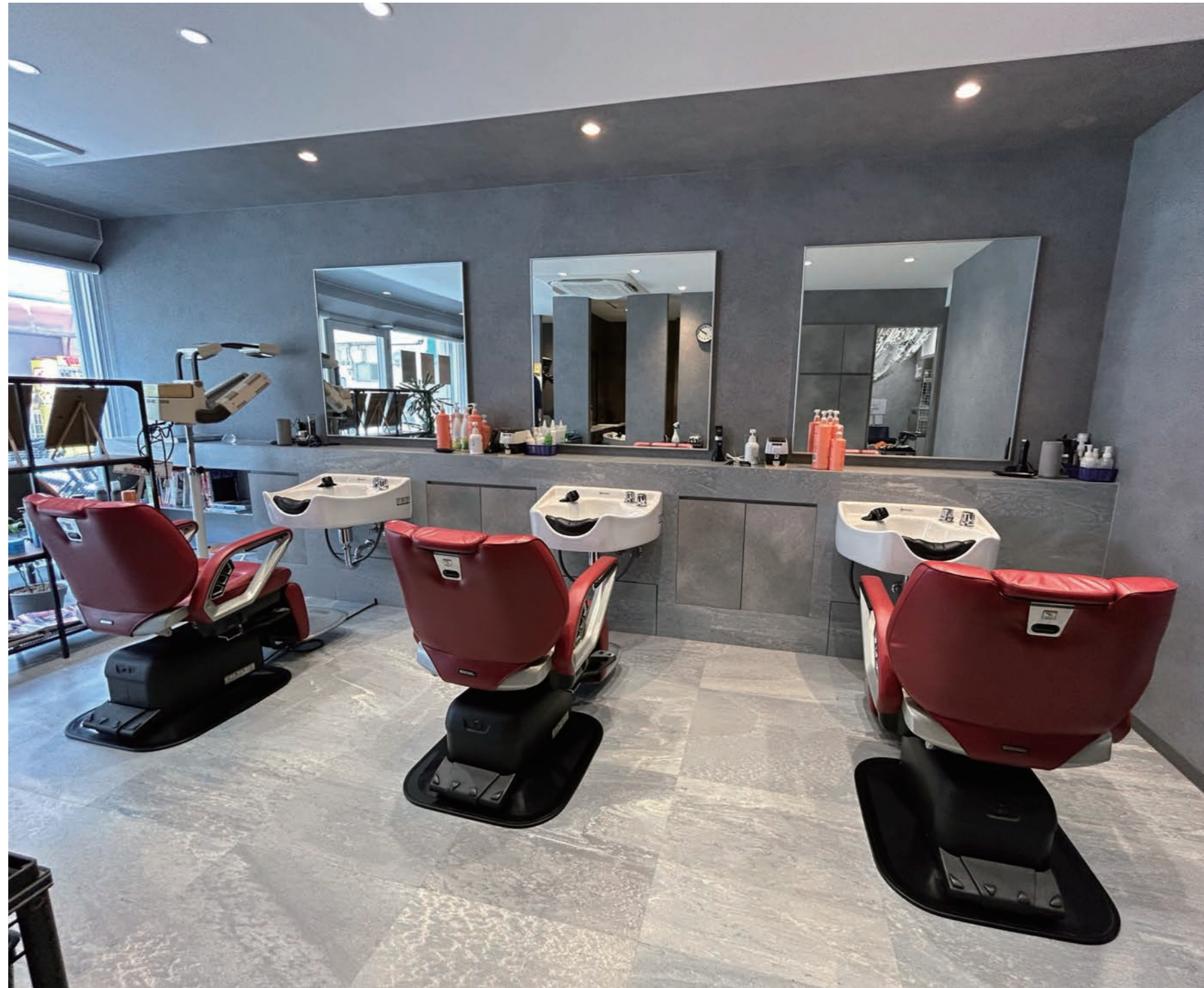
モノトーンの店内に映える施術椅子や鏡、客待ちの椅子などは、旧店舗で使用していたものを再利用している