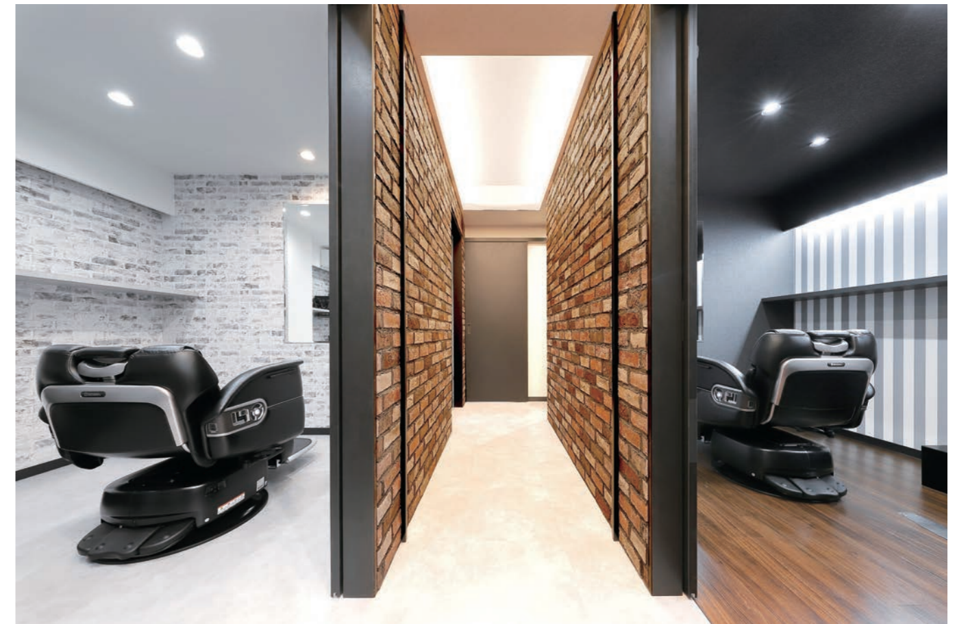
各部屋への通路は本物のレンガを使用。自然な風合いが高級感と味わいのある空間を演出

新装年月 / 2023年7月 面積 / 58㎡ 椅子台数 / 施術椅子4台 設計・施工 / タカスペースデザイン株式会社 タカラベルモント株式会社 立地 / 住宅街。駅やショッピングセンターが近くにある 最寄り駅 / JR東北本線・日和田駅から徒歩15分 営業時間 / 平日・土曜日 10:00 ~ 19:00 日曜日・祝日 9:00 ~ 18:00 おもな客層 / 約80%が20代以上。男女比率は5:5 おもな料金 / カットのみ 3850円~ カラーのみ 5500円~ パーマのみ 5500円~ ヘッドスパ 4950円~