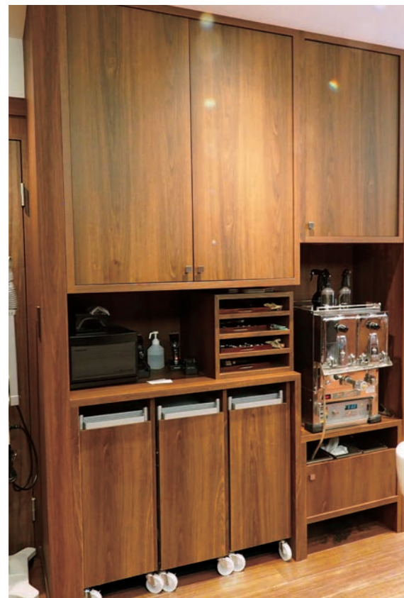
基本的に物は収納して、店内をすっきりさせている