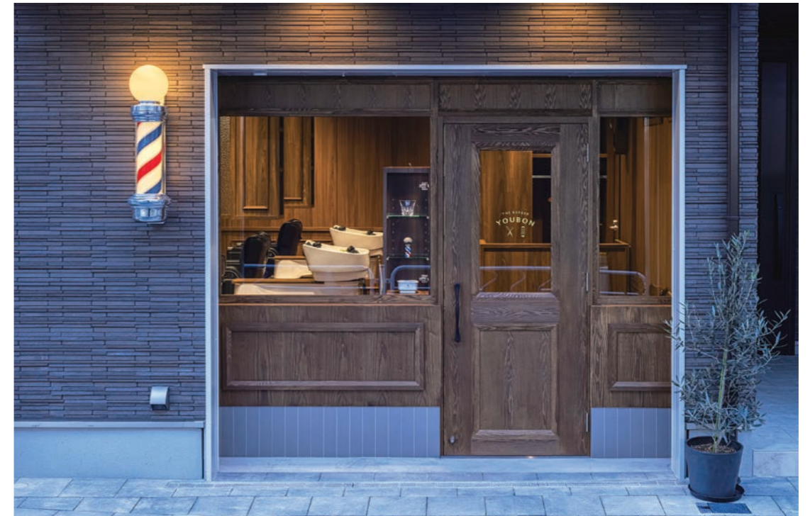
外壁はホテルのロビーや高級マンションの入り口に使用されるタイルをチョイス

改装年月 / 2023年5月 面積 / 34.8㎡ 椅子台数 / 施術椅子4台 設計・施工 / タカラスペースデザイン株式会社 タカラベルメント株式会社 立地 / マンションが多い住宅街 子育て世代が多く住んでいる 最寄り駅 / 東京メトロ東西線・西葛西駅から徒歩8分 営業時間 / 平日・土曜日 10:00 ~ 21:00 日曜日・祝日 9:00 ~ 20:00 おもな客層 / 男性がメイン。男女比率は9:1 おもな料金 / カット 5000円 カラー 4500円~ パーマ 6500円~ ヘッドスパ 4400円~