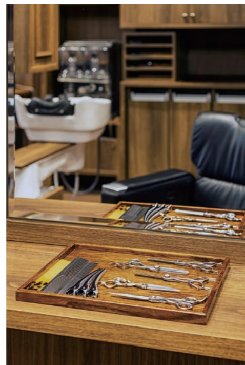
一般のお客様はプロの道具を目にする機会があまりないため、こだわりの道具をトレーにのせてカウンターに置き、仕事をしている。興味を持つお客さまは多く、スチーマーも“かっこいい”といわれる