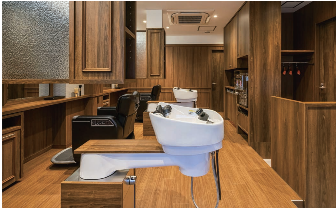
パーティションは、座ると隣の席が見えるようで見えない絶妙な高さで圧迫感がない。鏡前のカウンターは、下にキャリーバッグが置ける高さにした