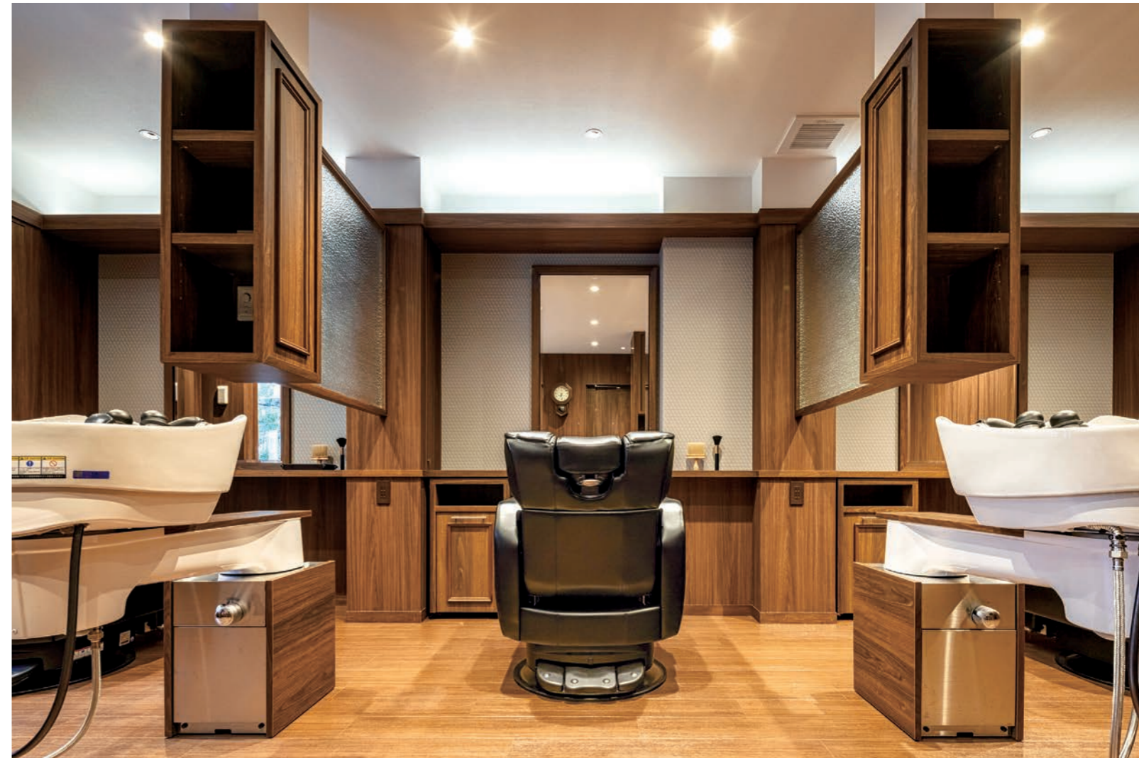
コンセプトは“上質な空間、時間、サービスの提供”。すべて半個室のため、プライベート空間が保てる