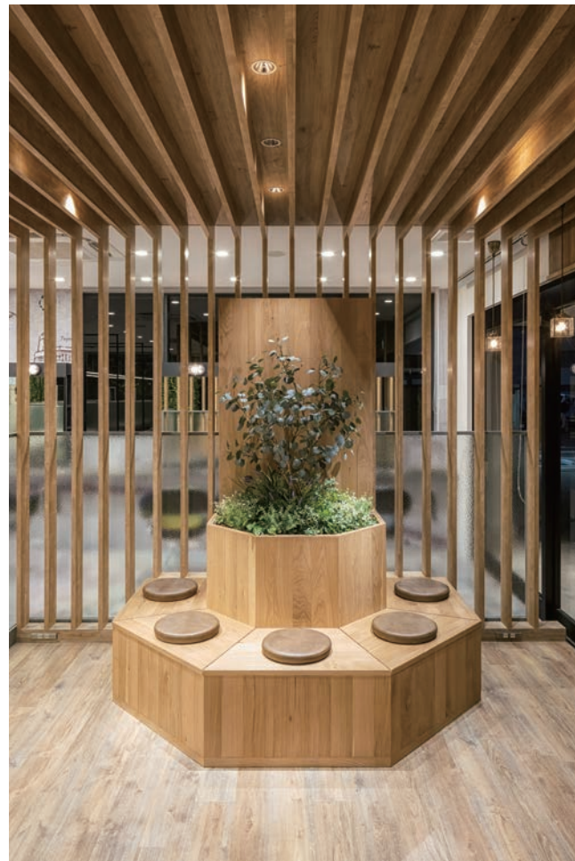
ガラス張りの入り口から、柔らかな光が差し込むエントランスには、ウッド調のレセプションと、客待ち用のベンチが置かれている。ベンチの背もたれの中に心和む植栽が置かれており、施術面とは違った雰囲気になっている