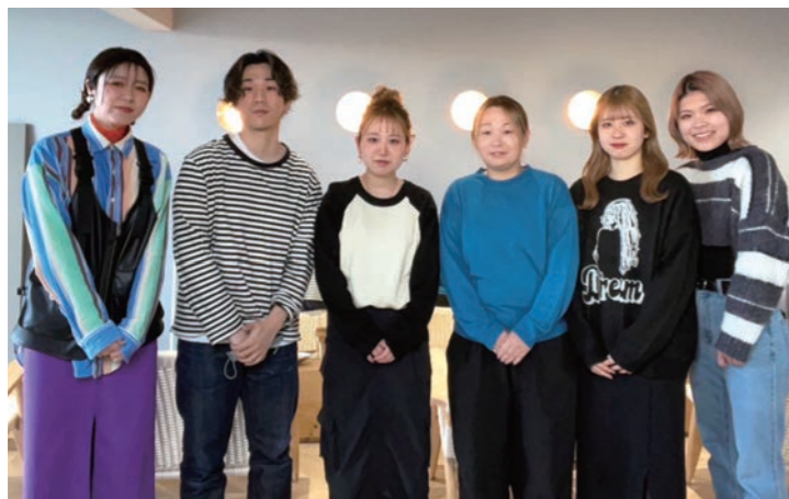
スタッフの皆さん