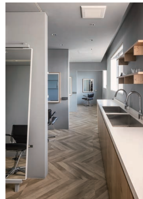
オープンで清潔感あふれるディスペンサリー。各部屋からすぐに行けて、動線もスムーズ