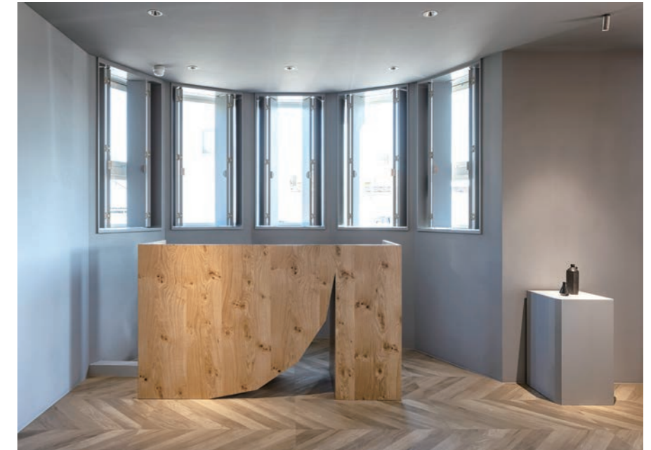
自然光がたっぷり入るレセプション。木製のブラインドで日差しの調節ができる。少しエッジの効いたテーブルがアクセントになって、おしゃれ感を増している。香りでお店を印象づけたいと、ルームフレグランスで上品な香りを漂わせている