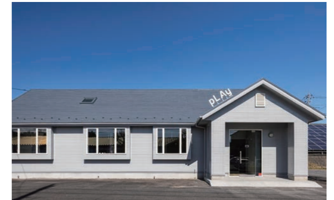
pLAyのLAはハワイ語で太陽の意。“太陽のような存在になる”という願いが込められている