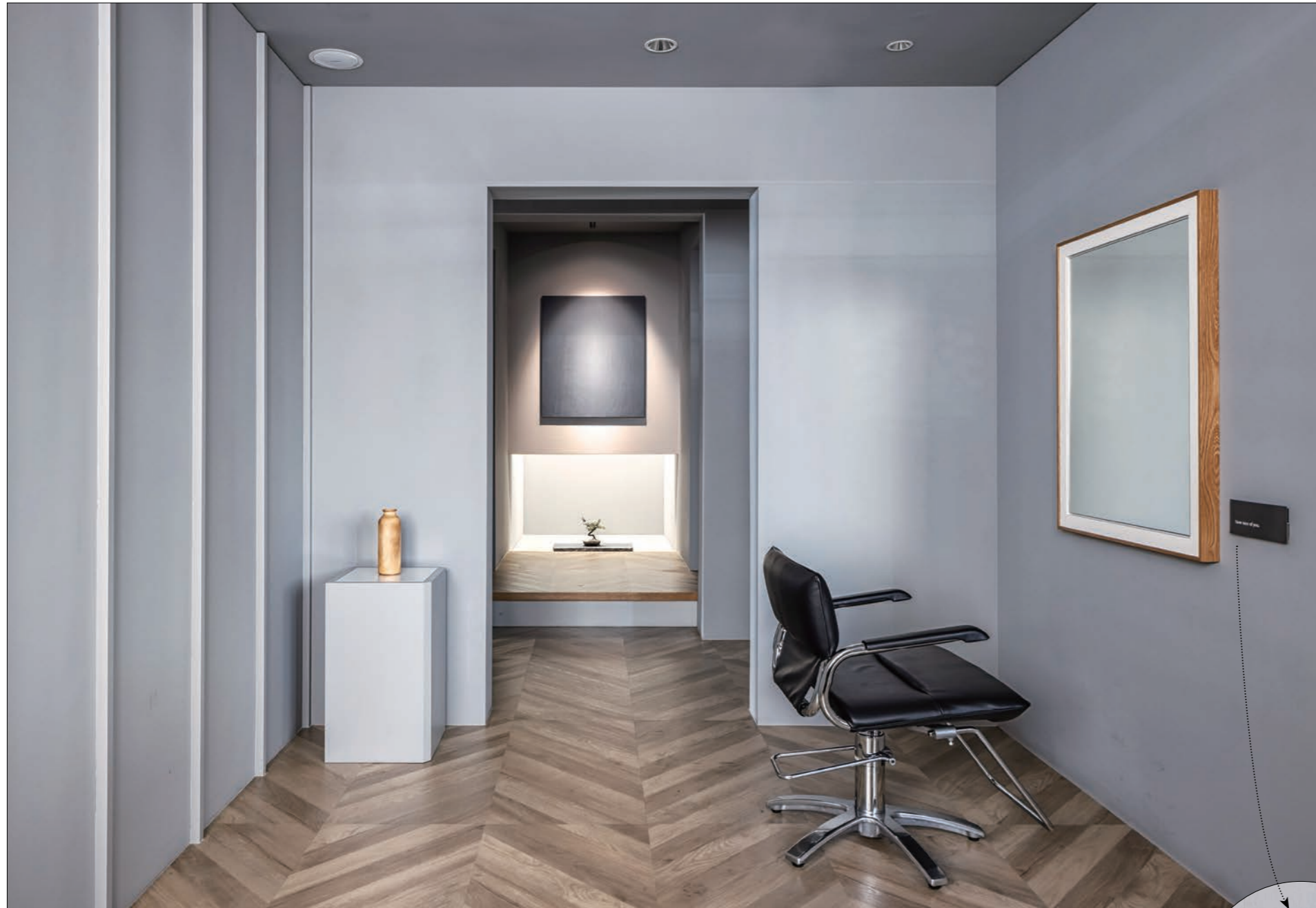
美術館を思わせる店内は、ナチュラルなヘリンボーンの床とグレーの壁色で落ち着いたくつろげる空間になっている。鏡には絵画のような額縁があり、ヘアスタイルを美しい作品として演出している