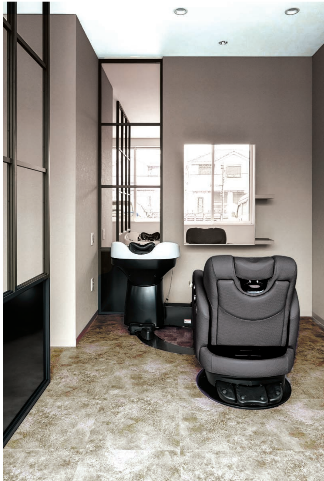
インダストリアルデザインをベースに、シャープで清潔感ある空間づくりを行なった。格子の間仕切りはスチール製