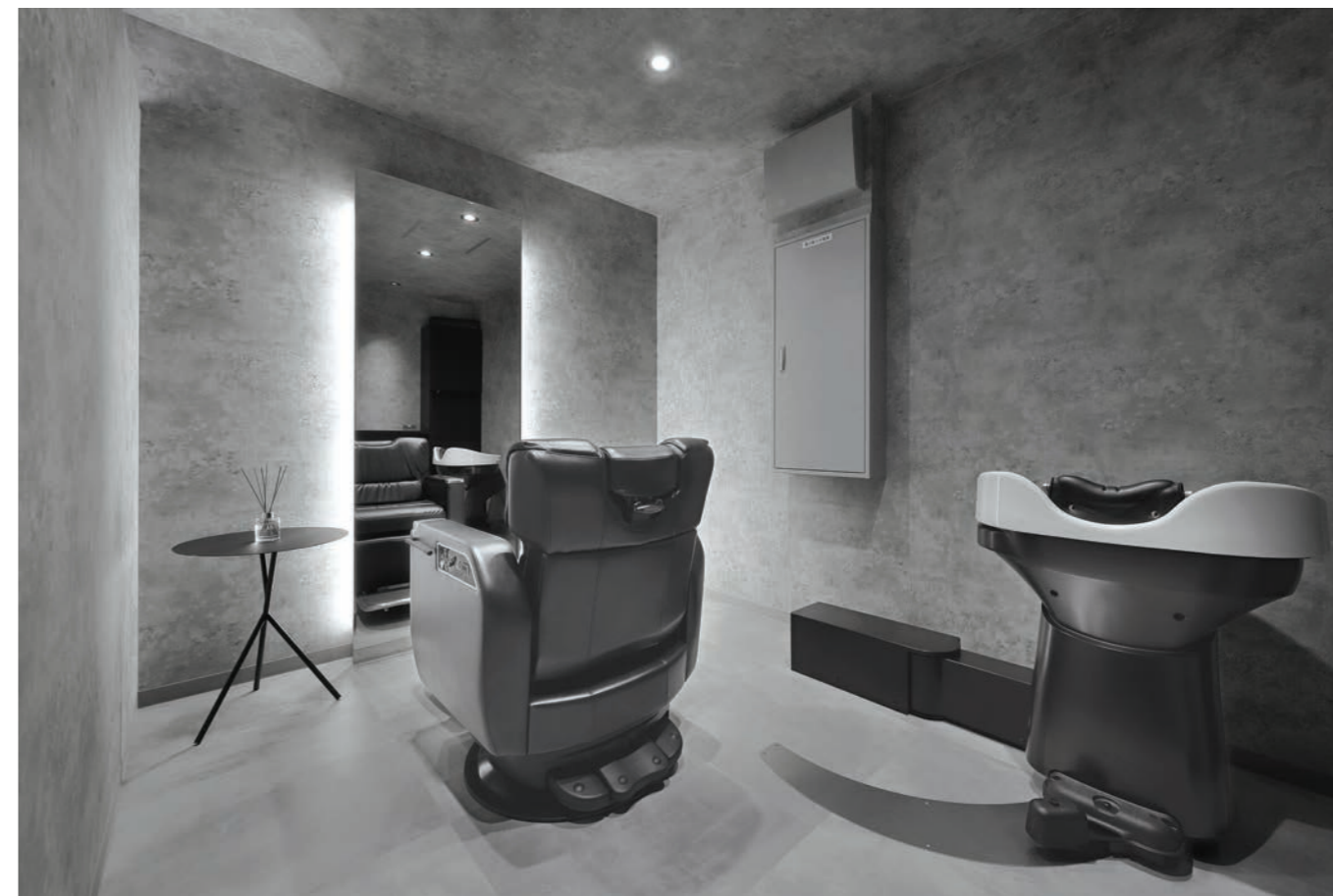
完全個室で、リラックスできる空間を提供。大きな鏡のバックライトが高級感を演出