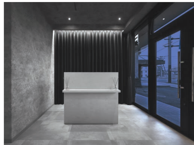
広々としたエントランス