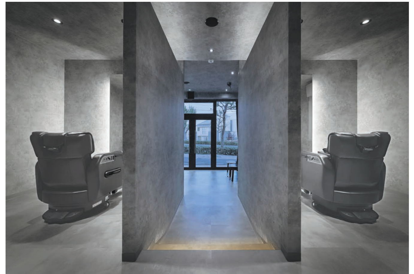
通路で仕切られた個室