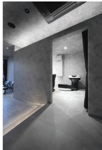
シンプル、高級感、おしゃれ感の調和がとれた店内