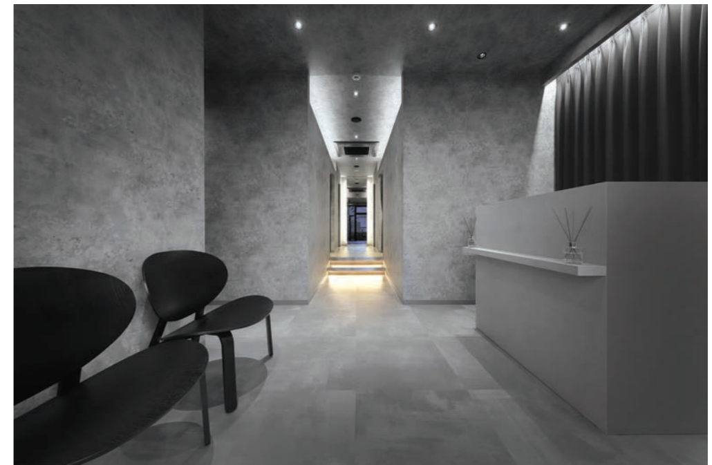
客待ちとレセプション。ゆったり座れる椅子を用意。通路の一番奥は鏡になっており、入り口が写っている。個室は通路の両サイドにある