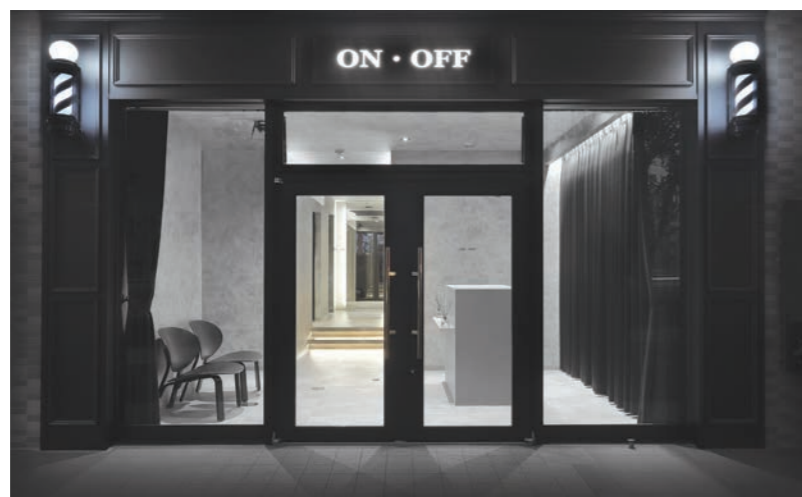
お客さまに興味を持ってもらえるよう、店名以外の情報をあえて出さなかったシンプルな外観