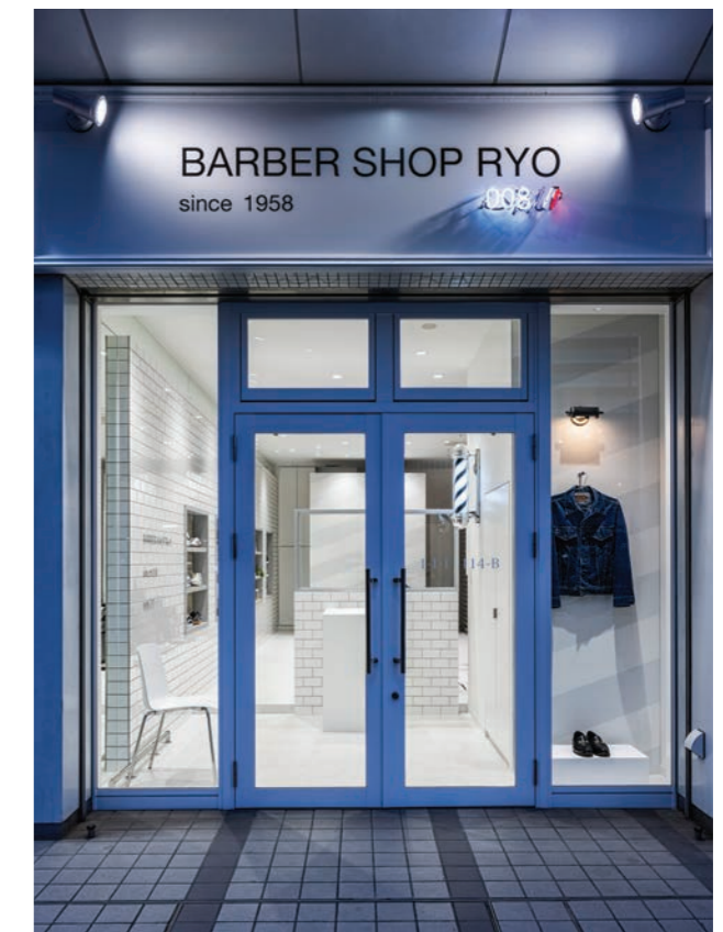
セレクトショップをイメージした、透明感のある内外装。スニーカーショップと間違えて入店する人も……