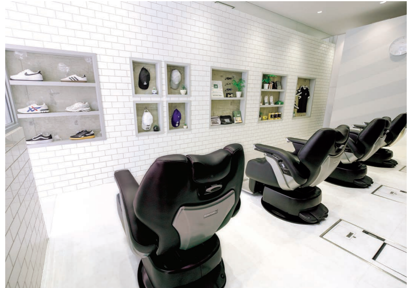
これまでの常識に縛られることなく、新しい BARBER の価値を社会に発信していきたいと、サロンコンセプトを「鏡のない BARBER」とした。前面のディスプレイには、キャップやスニーカーなどを置いて、オシャレを楽しみたくなるような空間に。お客さまからは「スタイリッシュでオシャレな空間!」と高評価を得ている