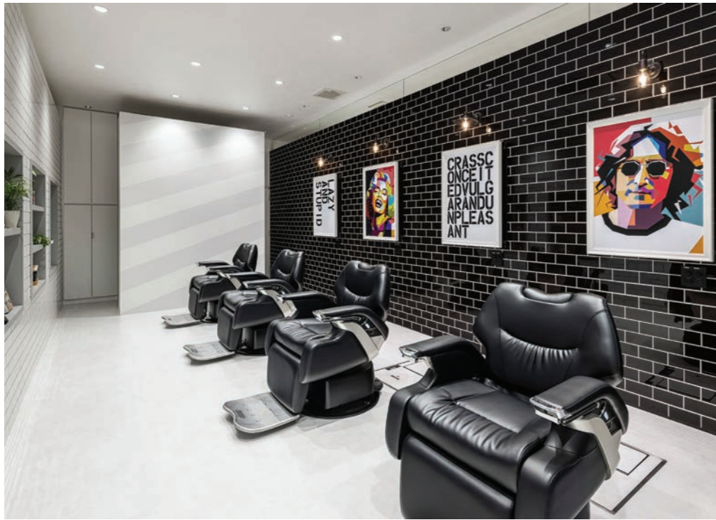
施術椅子の後ろは美術館風に、ジョンレノンやマリリンモンローなどのアートが飾られている。黒いタイル側のダウンライト一列は、調光が可能