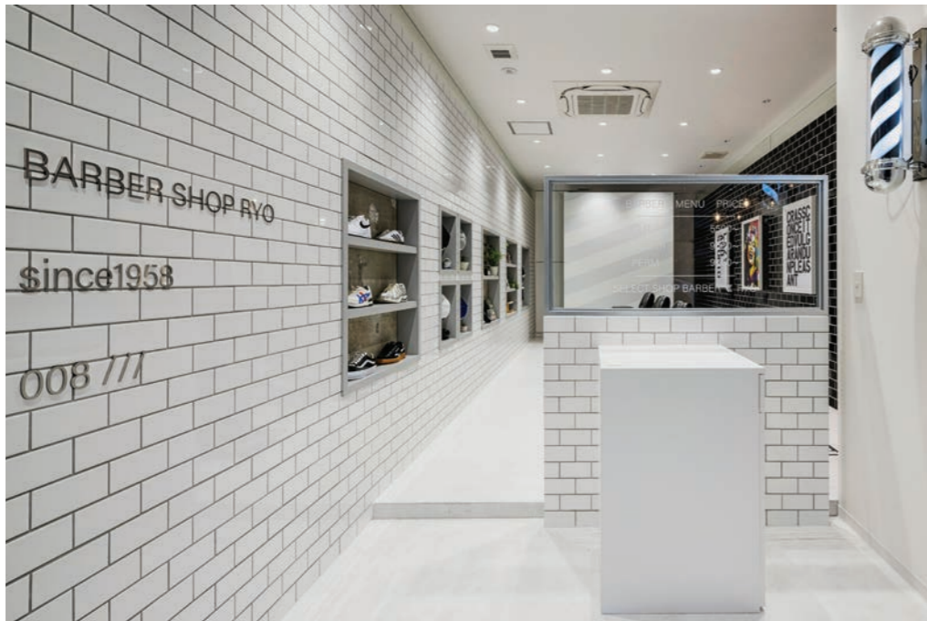
白が基調の明るい店内。壁の店名下にある 008/// は、BARBER SHOP RYO の店舗目録の証