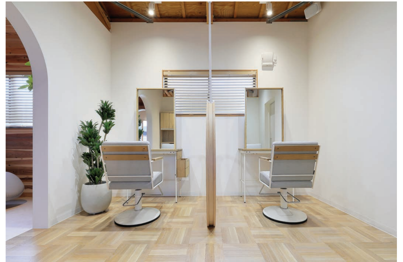
木材をふんだんに使用し、木や花のあるナチュラルでガーデンカフェ風なサロンは、長時間滞在しても居心地が良い