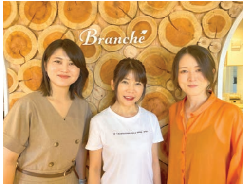
田口代表（中央）とスタッフの皆さん