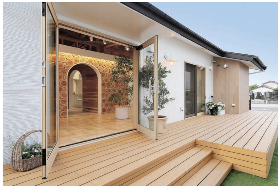
平屋の民家をリノベーションしたガーデンカフェ風なサロン 正面の栗駒杉でできた壁が、木の香りとともに癒やされると評判が高い