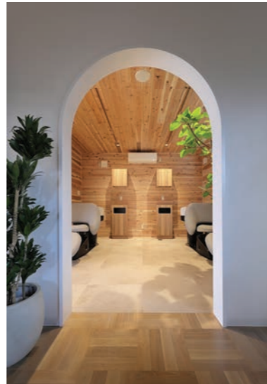
出入り口はアーチ型にして、柔らかさを演出。また、すべての壁面を出入りしやすくしてあり、動きやすい