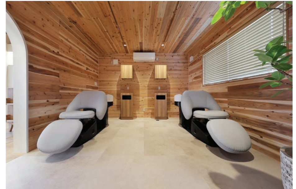
宮城県のブランド材「栗駒杉」を、ふんだんに使用した店内 シャワータイムはまるで森林浴をしているよう！