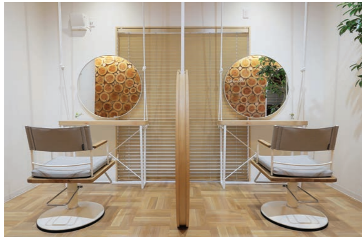
鏡に映る天然木に心が和むと高評価