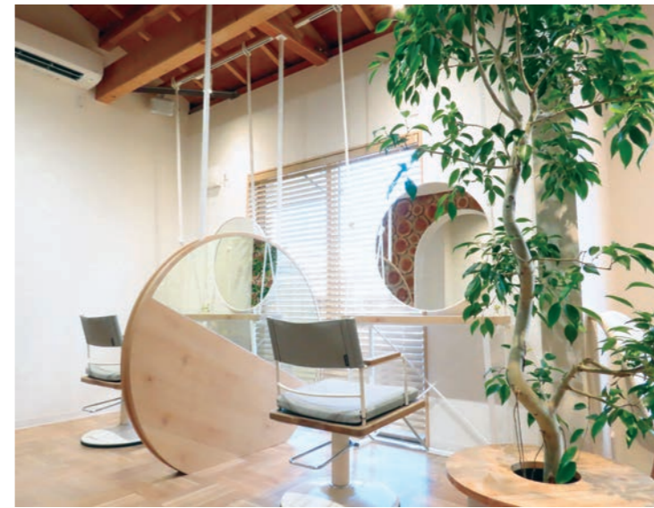
パーティションで区切り、半個室にした施術ブース。パーティションは圧迫感が出ないように、円形で一部を鏡にしている。さらに圧迫感をなくすため、天井も抜いた。セット面は遊び心でブランコ風に