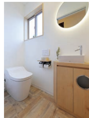
清潔感あふれるトイレ